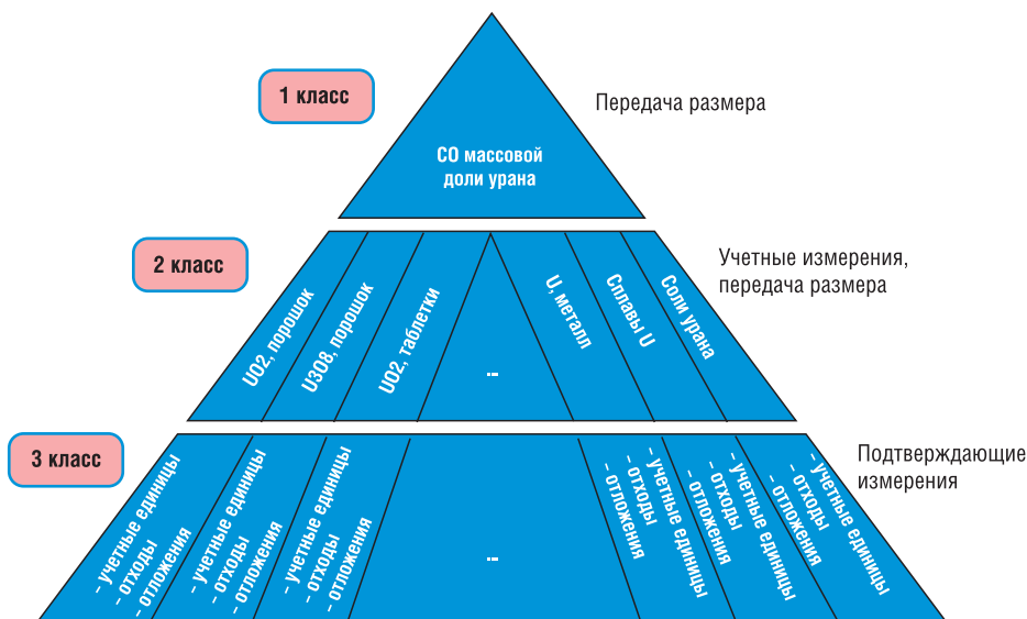
Рис. 1. Учет и контроль урана. Принцип построения системы СО

Для метрологической поддержки данной вертикальной системы были разработаны три отраслевых стандарта: