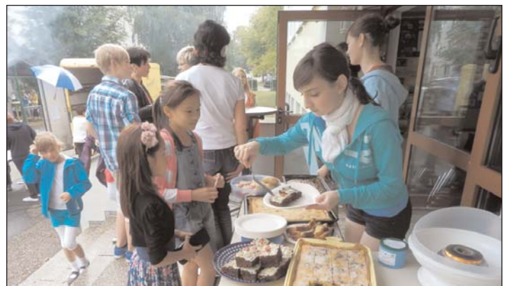
Internationales Wirtschaftsgymnasium: Sommerfest