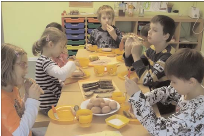
Frühstück im Little Stars