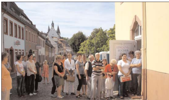
Bibliothek: Flohmarkt – Besucherandrang