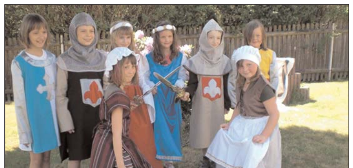
Museum: Schicke neue Kostüme