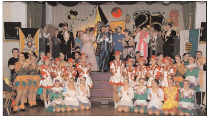
Seit 1986 sorgen die Mitglieder des Geithainer Carnivals Clubs mit ihren Programmen für Spaß und Frohsinn bei den Bürgern.