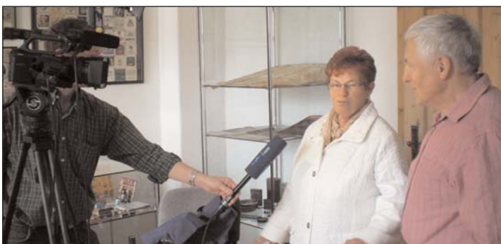
Museum: Das Fernsehen filmt zu Was sammelt Man(n)