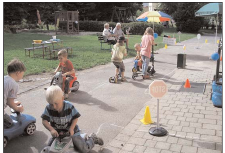
Wirbelwind: Sommerfest mit Verkehrspakur