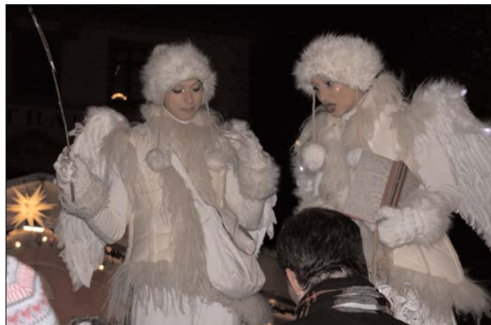
Gewerbeverein: Große Engel auf dem Weihnachtsmarkt