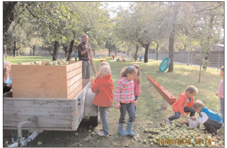
Vom Apfel zum Saft im Little Stars