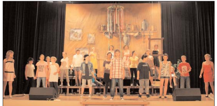
Paul-Guenther-Schule: Premiere „Hexenhaus“ (Musicaldarsteller aus Klasse 5/6)