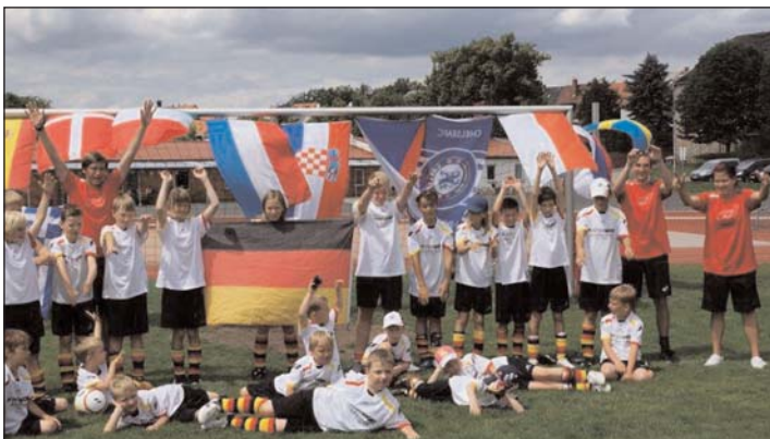
Fußballcamp 2012 FSV Alemannia Geithain