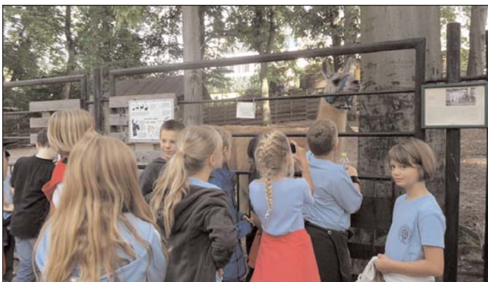
Internationales Wirtschaftsgymnasium: Besuch im Tierpark Geithain