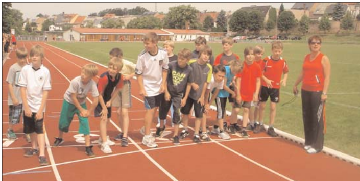
Paul-Guenther-Schule: Bundesjugendspiele in der Leichtathletik im Henning-Frenzel-Stadion (111 Schüler erfüllen die Bedingungen für das Sportabzeichen)