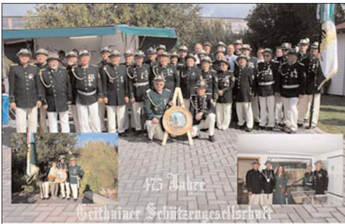
Schützenverein: Gruppenbild 2012