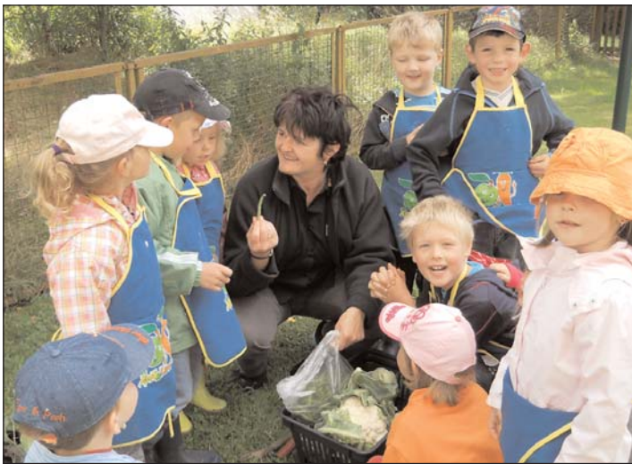
Kleine Strolche Niedergräfenhain: Gartenprojekt mit EDEKA