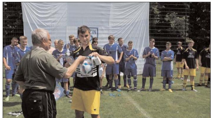
Kreispokalfinale 2012 A-Junioren SG Zschadraß-Colditz gegen FSV Alemannia Geithain