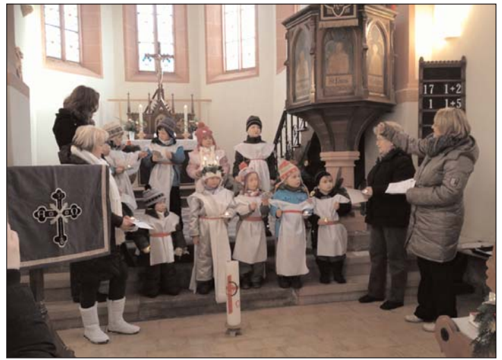
Kleine Strolche Niedergräfenhain: Kindergartenkinder gestalten den Gottesdienst mit