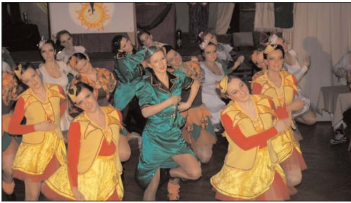
Auf sein 25-jähriges Bestehen konnte der Geithainer Carneval Club in der Saison 2011/2012 zurückschauen. Mit einem Best-off-Programm erinnerte er Höhepunkte dieser Zeit. Mit dabei natürlich auch stets die Aktiven der Funkgarde, die diesmal mit einem Jahreszeiten-Tanz aufwarteten.