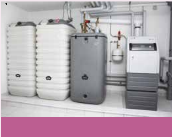
Foto 1: Moderne Öl-Brennwertgeräte arbeiten effizient und passen sich automatisch den Gegebenheiten im Haus an.