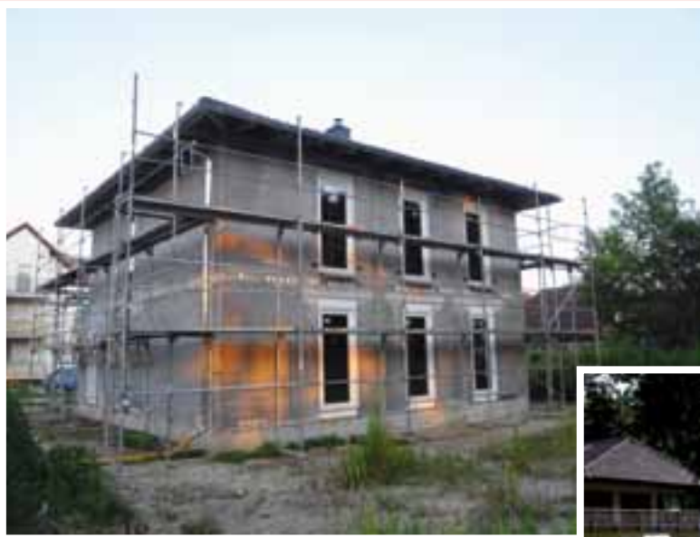
Leichtbetonwände mit einer geringen Rohdichte haben einen höheren Wärmedämmwert.