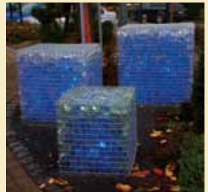
Gabionenleuchte als Würfel.