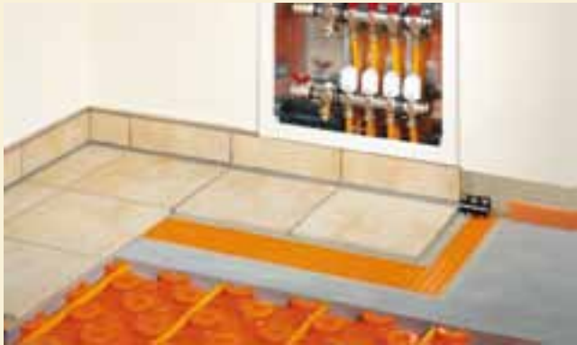
BEKOTEC-THERM ist ein perfekt aufeinander abgestimmtes Fußbodenheizsystem für den schnellen und sicheren Aufbau.