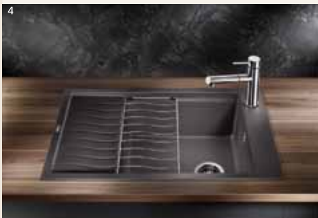
Foto 1 - 3: Kompakte Spülen mit präzise aufeinander abgestimmtem Zubehör können die knappe Arbeitsfläche direkt am Vorbereitungszentrum sinnvoll erweitern. Zum Beispiel Blanco Elon XL 6 S, sie verfügt über durchdachtes und funktionales Zubehör: So lässt sich die Abtropffläche im Handumdrehen nach innen vergrößern, in dem das elegant geschwungene Tropfgitter einfach an die Abtropffläche angedockt wird.

Foto 4: Blanco Elon XL 6 S überzeugt mit einem äußerst geräumigen Becken und einer praktisch konzipierten Abtropffläche bei gleichzeitig geringen Außenmaßen. Perfekt zur Elon XL 6 S passt die formschöne Amatur Blanco Alta-S Compact.