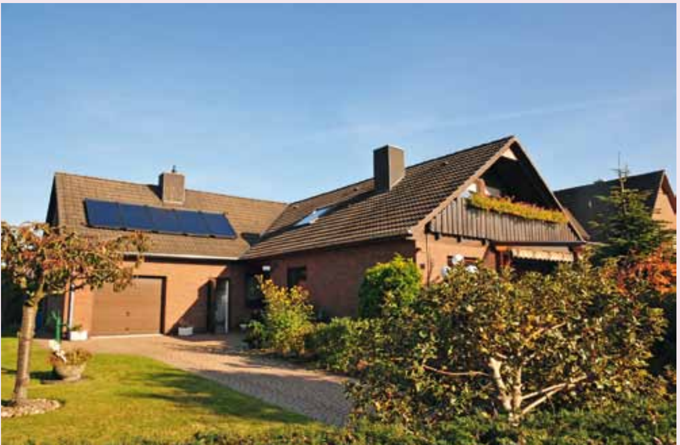
Erfolgreiche Sanierung: Mit einer Investition von rund 20.000 Euro in eine neue Hybridheizung konnten die Hausbesitzer den jährlichen Heizölbedarf ihres 35 Jahre alten Einfamilienhauses um 43 Prozent senken.