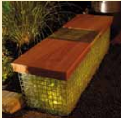
Gabionenleuchte als Sitzbank.