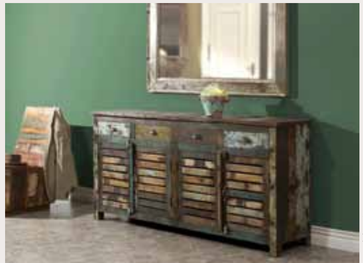
Die Avadi-Kollektion besteht zu 100 Prozent aus recyceltem Hart- und Teakholz.

Jahr hinweg. Besonders in den feuchten Winter- und trockenen Sommermonaten macht diese Pufferfunktion massives Holz zu einem optimalen Material für wohngesunde Möbel. „Quasi zum Leben erweckt wird der natürliche Werkstoff dank seiner einzigartigen Zellstruktur“, erläutert Ruf. Die Zellen des Holzes sind auf vielfältige Weise miteinander verbunden: zu Fasern, die die Festigkeit des Holzes sichern, zu Gefäßen, die Wasser transportieren und zu sogenannten Parenchymzellen, die Nährstoffe verteilen. Diese Struktur verleiht Holz die Eigenschaft, Feuchtigkeit aus der Luft aufzunehmen und auch wieder abzugeben. „Es besteht also ein dauernder Ausgleich zwischen Luft- und Holzfeuchte. Man sagt auch: Holz ist ‚hygroskopisch‘. Es ändert seinen Feuchtegehalt bei wechselndem Umgebungs-