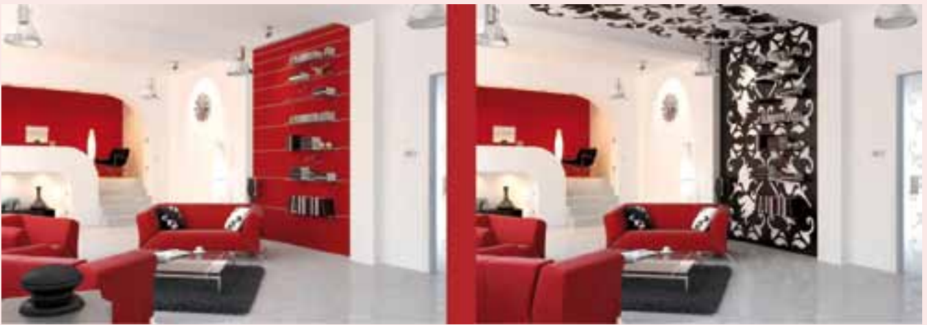
Die markante Gestaltung mit Regalen ...