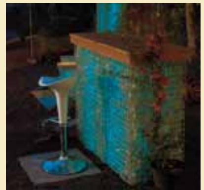
Gabionenleuchte als Theke.