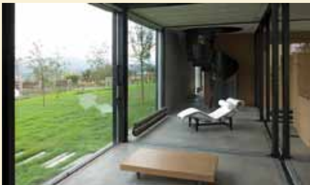
Schlicht ästhetische Ventilheizkörper bringen Harmonie in den Glasanbau.