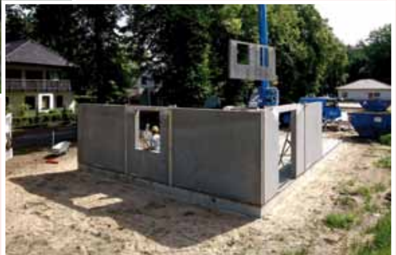
Die Wände für einen Bungalow sind schnell an einem Vormittag montiert.

bestehen, spielt dabei eine maßgebliche Rolle.