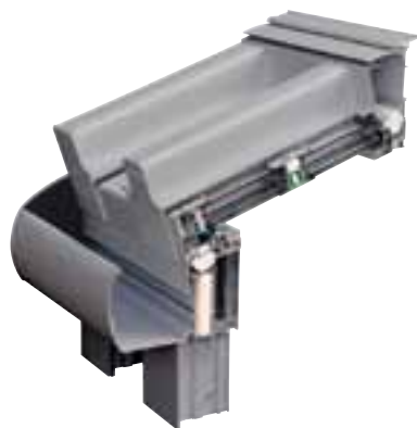
Systemschnitt der Serie 56000i