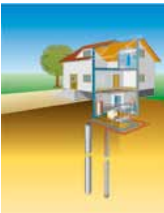
Bei der Nutzung von Erdwärme, auch oberflächennahe Geothermie genannt, zapft man die im Erdreich gespeicherte Wärme an.

Photovoltaik und Solarthermie sind in aller Munde. Dass das Thema erneuerbare Energie auch noch andere Möglichkeiten bereithält, gerät dabei fast ins Hintertreffen. Beispielsweise bieten Windkraft und Geothermie interessante Zukunftsperspektiven.