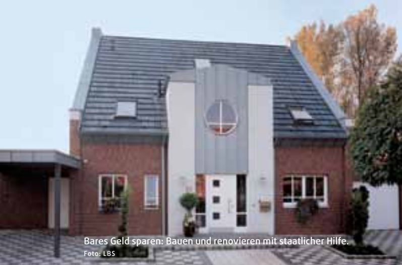
Bares Geld sparen: Bauen und renovieren mit staatlicher Hilfe.