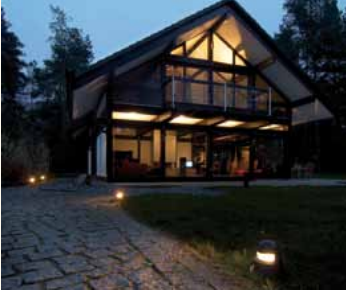
Breit strahlende Leuchten machen unebene Stellen sichtbar und bieten auf dem Weg zum Haus Orientierung.