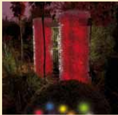
Gabionenleuchte mit Wasserbalken und Endstücken.