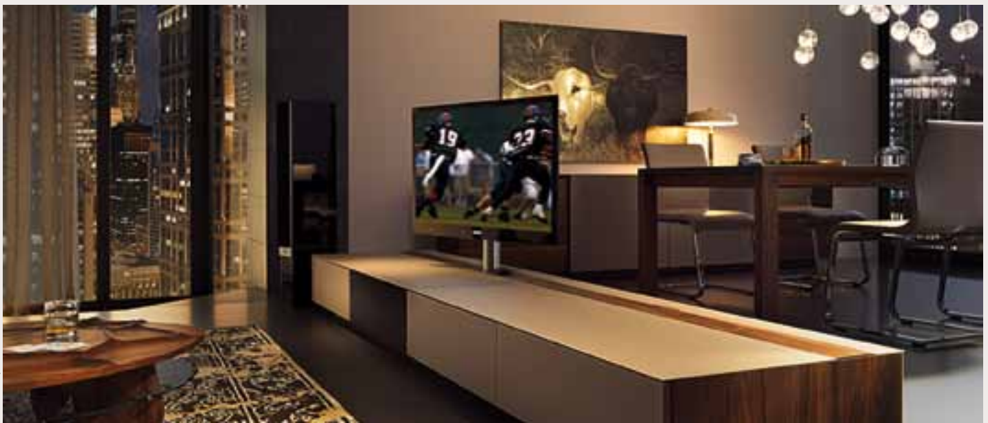
Die Form und die Interpretation des Sideboards ist neu, das Material ist klassisch.