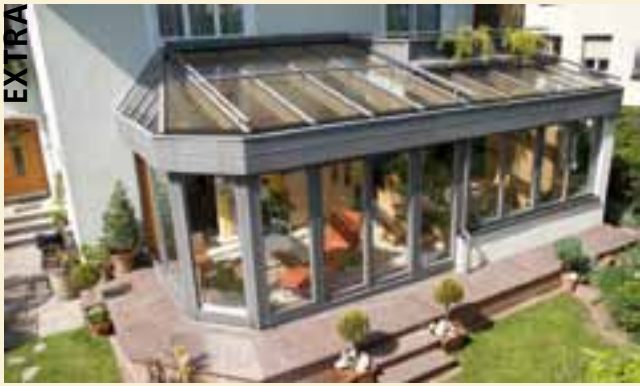
Wintergärten machen ihren Besitzern viel Freude – vorausgesetzt, das Klima stimmt.