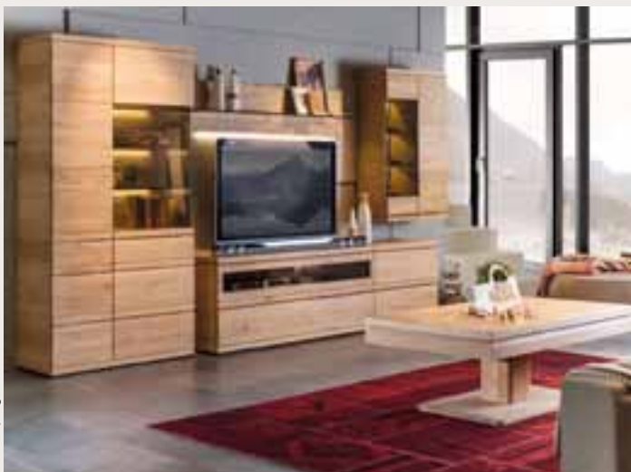
Massivholz trägt zu einem gesunden Wohnstil bei.