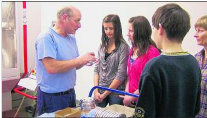
Schüler zu Gast im Unternehmen Clausnitzer & Mitte Erodierbetrieb GmbH in Mülsen