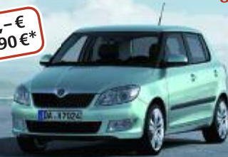
Abb.: Škoda Fabia, enthält Sonderausstattung

Vollkaskoschutz für mtl. 5,- € und Haftpflicht für mtl. 19,90 €*