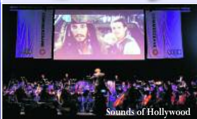
Sounds of Hollywood

Geschäftsstelle Greiz, Telefon (0 36 61) 45 23 08, Fax (0 36 61) 45 55 44 Geschäftsstelle Reichenbach, Telefon (0 37 65) 1 34 70, Fax (0 37 65) 2 11 70