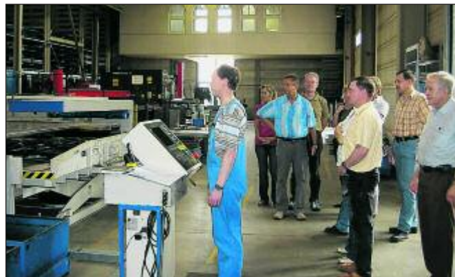
Zur Lehrerakademie stellte sich auch die Schwalbe Metallbau GmbH in Mülsen vor, die Bleche bearbeitet.

Die Anmeldung mit dem Formblatt „Meldung zur Fortbildungsveranstaltung“ ist bis zum 17. Juni 2011 bei der Sächsischen Bildungsagentur Zwickau, Referat 41 Fortbildung, Johannes Kühnel, Telefon: 0375 4444-124, erforderlich. Die Veranstaltungsnummer lautet Z 02438 im Online-Fortbildungsprogramm für Lehrer www.sachsen-macht-schule.de/schule . Sobald die Sächsische Bildungsagentur Zwickau die Fortbildung genehmigt hat, kann jeder Lehrer sein