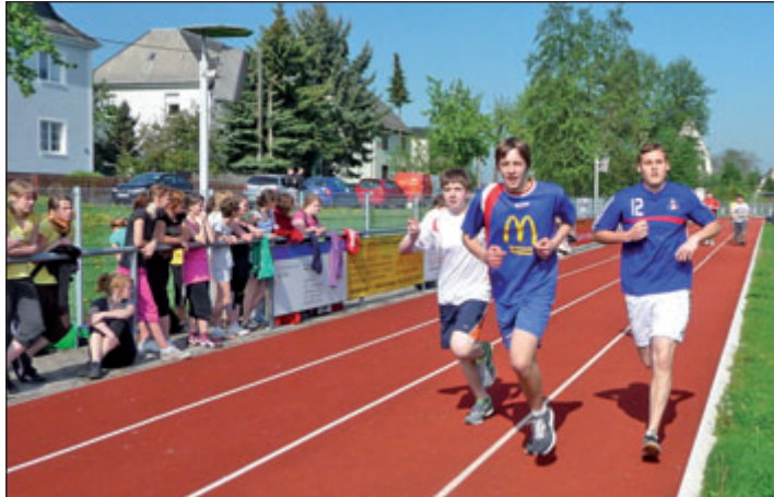
Die Jungen der Klassen 9g und 10g beim 1000m-Lauf.