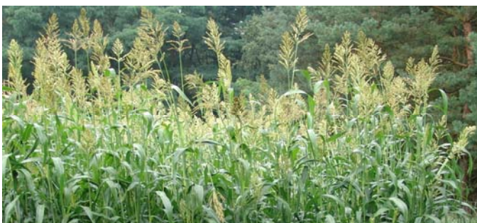
Abbildung 3: Sorghum bicolor x Sorghum sudanense