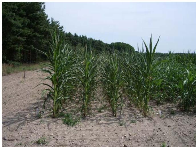
Abbildung 7: Trockenstress bei Mais (07/2006)

Die siebenjährigen Sortenprüfungen haben weiterhin ergeben, dass die Maissorten im Wesentlichen TS-Gehalte zwischen 31 und 36 % erreichten. Sie hatten zum Erntezeitpunkt ein gegenüber den Hirsen bereits weiter fortgeschrittenes Reifestadium erreicht. Unter den Sorghumhirsen erreichte nur „Lussi“ zuverlässig über den gesamten Untersuchungszeitraum TS-Gehalte zwischen 28 und 35 %. In einzelnen Jahren wurden auch für „Susu“ (2006 und 2009), „Bovital“ (2008 bis 2009), „True“ (2009) „Super Sile 20“ (2006), „Rona 1“ (2006), „Goliath“ (2007), „Biomasse 150“ (2011), „KWS Odin“ (2011), „RHS“ (2011) und „KWS Zerberus“ (2011) TS-Gehalte > 28 % festgestellt.