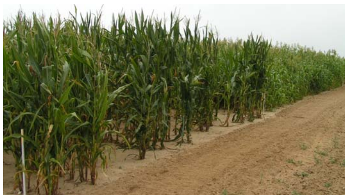
Abbildung 8: Sortenversuch in Welzow (08/2009)

* BB Mais: TM-Ertrag in dt TM/ha und TS-Gehalte in % (Mittel von zwei Sorten: 2007: S 240/S 240, 2008 bis 2010: S 240/ S 280, 2011: S 280/S 260)