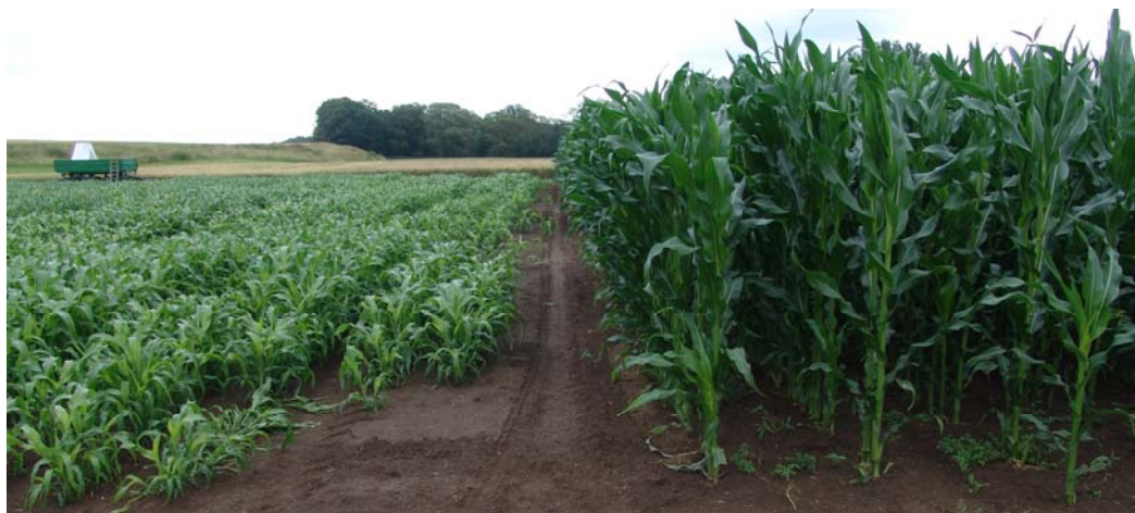
Abbildung 9: Sortenversuch in Heßberg (rechts: Mais, links: Sorghumhirsen) (07/2009)