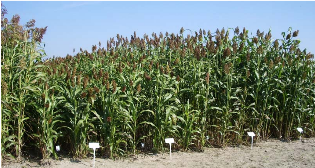
Abbildung 2: Sorghum bicolor -Bestände am Standort Güterfelde

Futter-Typen: viel Grünmasse, große Wuchshöhe, geringer TS-Gehalt, schwach bestockend Zucker-Typen: höherer Zuckergehalt, geringer TS-Gehalt, schwach bestockend Faser-Typen: höherer Cellulosegehalt, schwach bestockend Körner-Typen: geringe Wuchshöhe, kompakte Rispe, hohe TS-Gehalte, stark bestockend