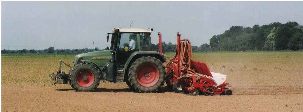
Abbildung 4: Aussaat von Sorghumhirsen mit Einzelkornsaattechnik am Standort Köllitsch (2008)

Die Aussaattiefe beträgt 2-4 cm. Auf kapillaren Wasseranschluss ist zu achten.