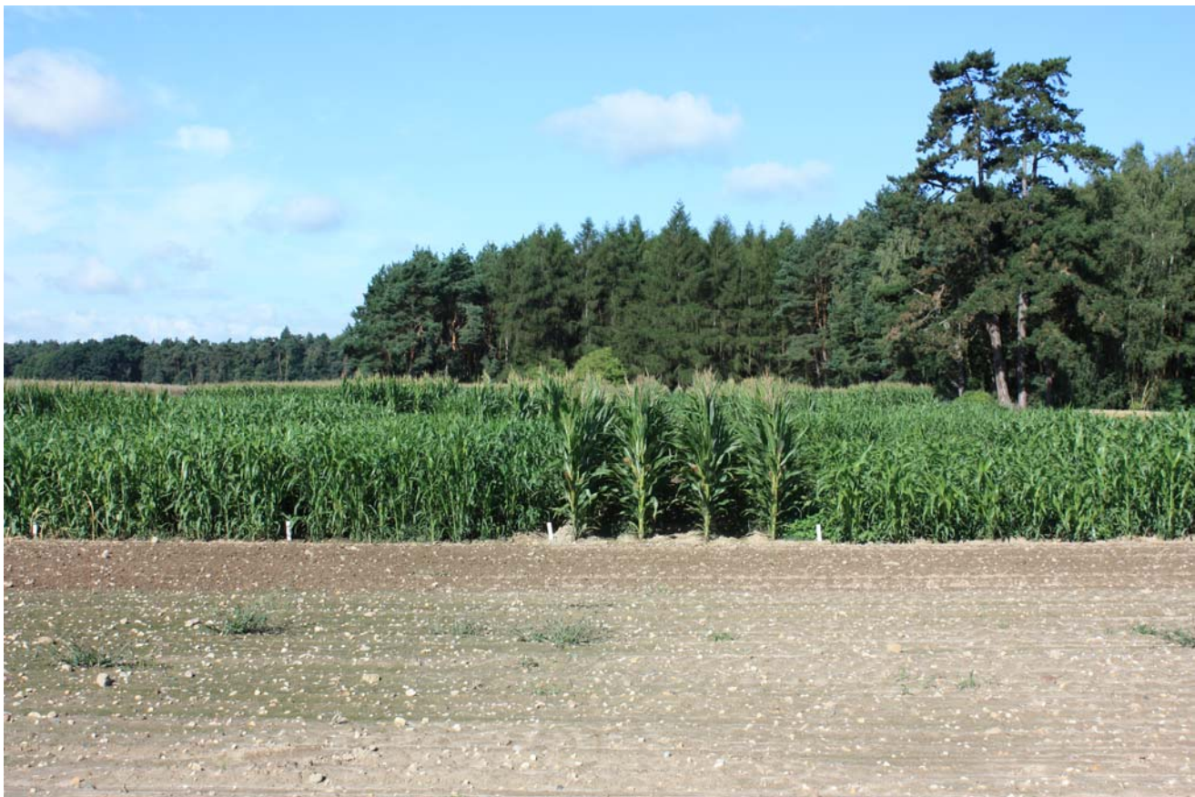
Abbildung 1: Sortenversuch mit Mais und Sorghumhirsen am Standort Trossin (2007)

Mit allen Projekten sollten Erkenntnisse zur Ertragsleistung moderner, leistungsstarker Sorghumsorten auf verschiedenen Standorten gewonnen werden. Dazu wurden Parzellenversuche (Abbildung 1) an Standorten mit unterschiedlichen Standort-eigenschaften (Bodenart, Ackerzahl, Klima) angelegt.