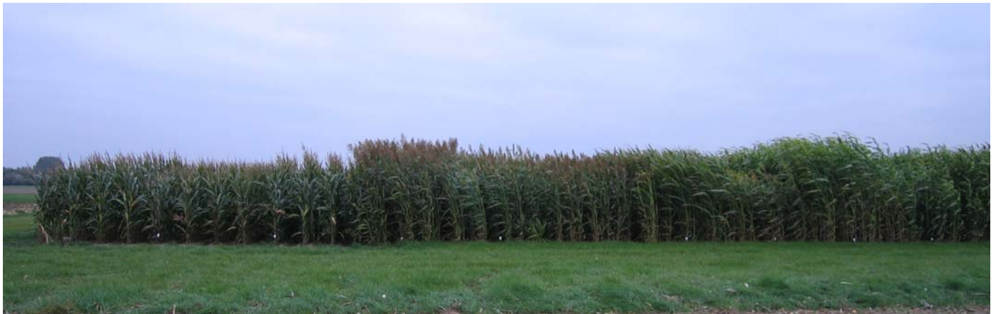
Abbildung 6: Sortenversuch in Gülzow (08/2010)

Die Erträge von Mais und Sorghum unterlagen starken jahresabhängigen Schwankungen (Tabelle 7). 2010 erreichte die Sorghum bicolor x Sorghum sudanense -Sorte „Lussi“ einen geringfügig über dem Mais liegenden Trockenmasseertrag. Die Sorghum bicolor -Sorten „Goliath“ und „Sucrosorgo 506“ erzielten im Anbaujahr 2010 deutlich höhere Erträge. Alle weiteren geprüften Sorghumsorten lagen markant unter der Ertragsleistung vom Mais. Einen für die Silierung optimalen TS-Gehalt zwischen 28 und 35 % erreichte nur die Sorghum bicolor x Sorghum sudanense -Sorte „Lussi“.