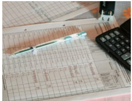
Eine genaue Dokumentation der Geschäftsvorgänge ist die Grundlage für die Öko-Kontrolle.

nehmers gegen die EG-Öko-VO ist die Kon-trollstelle zur Sanktionierung befugt; bei schwer-wiegenden Verstößen wird unverzüglich die zuständige Behörde informiert.