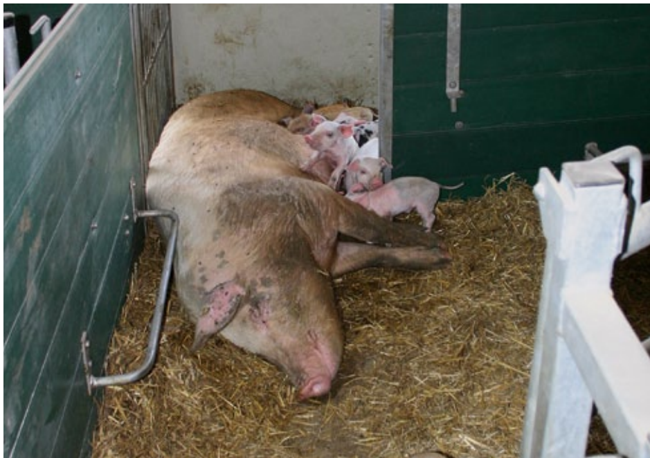
Im Ruhebereich muss eingestreut werden.

wenn die klimatischen Bedingungen dies erlauben. Zumindest ein Drittel der Bodenfläche muss befestigt und eingestreut sein.