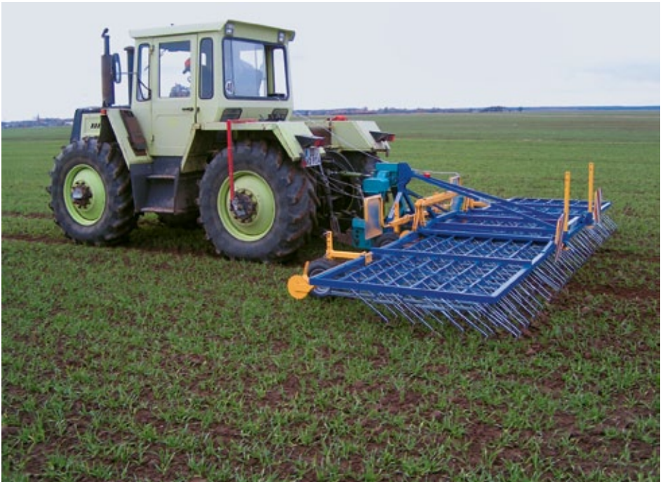
Striegeln ist ein leistungsfähiges und kostengünstiges Verfahren der Unkrautregulierung im ökologischen Landbau.

Die Richtlinien des ökologischen Landbaus schreiben die Verwendung von ökologisch erzeugtem Saat- und Pflanzgut vor. Damit steht der ökologische Pflanzenbau auch hinsichtlich der Saatgutvermehrung auf eigenen Beinen. Die Öko-Saatgutvermehrung kann dadurch ein wirtschaftlich interessanter Betriebszweig werden.