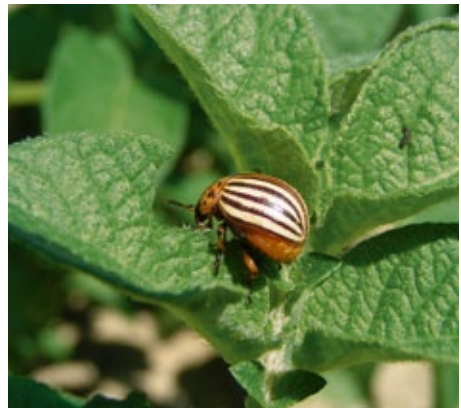
Kartoffelkäfer lassen sich im Larvenstadium mit einem Präparat auf Basis von Neem bekämpfen.

fer, Schwefel). Der Unternehmer hat über die Notwendigkeit der Verwendung dieser Mittel Buch zu führen und bei Kontrolle die Buchdokumentationen vorzulegen.