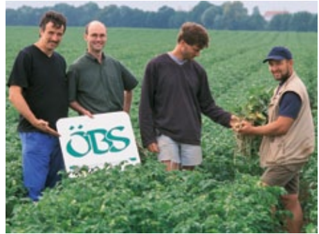
Erzeugerzusammenschlüsse helfen, den Vermarktungsaufwand zu senken.

Die Auswahl der Absatzwege im Rahmen einer Marketingstrategie gehört zu den wichtigsten Entscheidungen bei der Umstellung auf ökologischen Landbau. Zu den wesentlichen Kriterien bei der Entscheidungsfindung zählen neben rechtlichen und betriebsinternen Rahmenbedingungen, wie z.B. Standort und Ausstattung mit Arbeitskräften und Kapital, weitere Merk-