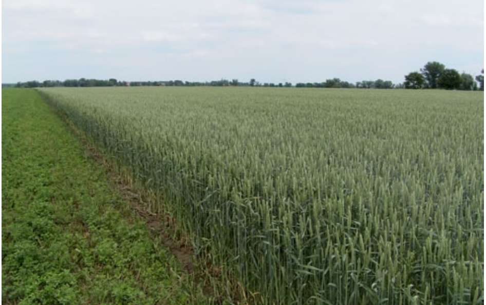
Luzeerne vor Winterweizen in der Öko-Fruchtfolge sichert den Stickstoffbedarf der Kulturen und verdrängt Unkräuter.

Vielfältige Fruchtfolgen mit Leguminosen sind der Schlüssel zum Erfolg im ökologischen Pflanzenbau. Allein damit lassen sich viele Pflanzenkrankheiten vermeiden, Unkräuter unterdrücken und der Stickstoff- und Humusbedarf decken. Stickstoff-(N)-Mineraldünger und chemisch-synthetische Pflanzenschutzmittel dürfen nicht eingesetzt werden. Ein befriedigendes Ertragsniveau mit guten Produktqualitäten wird dabei nicht nur über die N-Versorgung mit Leguminosen, sondern auch über Wirtschaftsdünger ge-