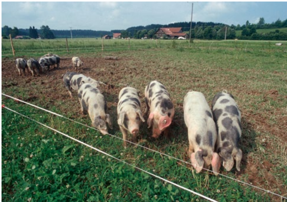
Auch Schweine bekommen im Öko-Landbau Auslauf oder Weidegang.

verdoppeln. Hormone dürfen nur zu therapeutischen Zwecken, nicht jedoch zur Brunstsynchro- nisation eingesetzt werden. Über Krankheitsvor- sorge, therapeutische Behandlung und tierärzt- liche Betreuung hat der Unternehmer Buch zu führen. Bei Kontrolle sind die Buchdokumentati- onen vorzulegen.