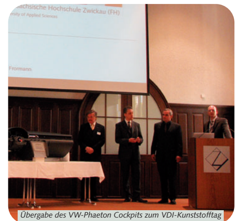
Übergabe des VW-Phaeton Cockpits zum VDI-Kunststofftag