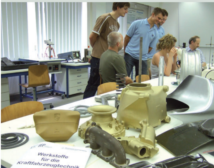
Zu „Campusfest meets Studiosus“ präsentierte das IfP im Labor „zerstörungsfreie Werkstoffprüfung“ eine Welt der Werkstoffe.