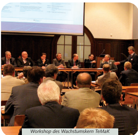
Workshop des Wachstumskern TeMaK