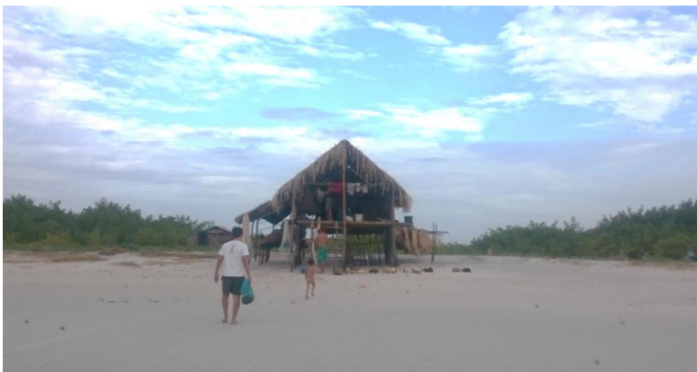
Figura 1– Rancho na praia Lombo do Cachorro

Os ranchos são construções feitas em madeira e geralmente cobertos de palha, servem para abrigar os pescadores enquanto permanecem na praia por períodos que podem oscilar entre 2 a 15 dias. Em sua simplicidade e rusticidade, servem aos objetivos que se destinam, ou seja, abrigar temporariamente pescadores em suas atividades de pesca, como na figura 1 apresentada a seguir.