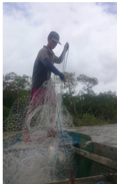
Figura 2 - Pescador organizando a rede para lança-la ao mar

Cesto de peixes no chão. Cheio de peixes, o mar. Cheiro de peixe pelo ar. E peixes no chão. Chora a espuma pela areia, na maré cheia. As mãos do mar vêm e vão, as mãos do mar pela areia a onde os peixes estão. As mãos do mar vêm e vão, em vão. Não chegarão aos peixes do chão. Por isso chora, na areia, a espuma da maré cheia.