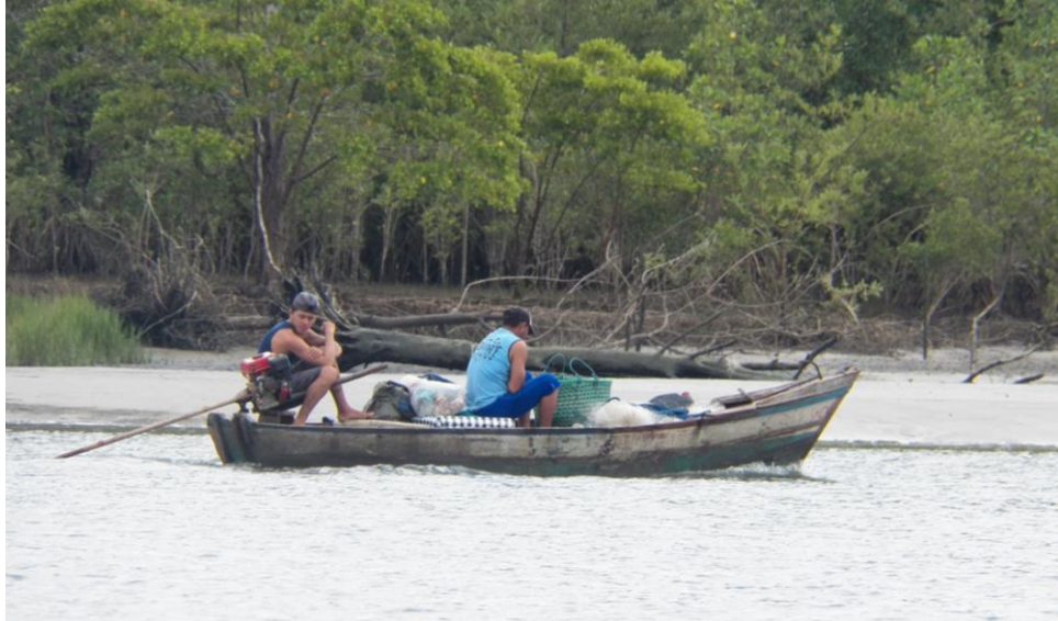
Figura 1– Estilo de embarcação utilizada na região

a região bragantina, as embarcações de caráter artesanal são pequenas e suportam uma pequena quantidade de pescado (ver figura 2), essas embarcações em sua maioria são construídas pelos próprios pescadores. Na pesca de arrasto, por exemplo, a embarcação funciona apenas como transporte, pois as redes são lançadas e arrastadas pelos próprios pescadores.