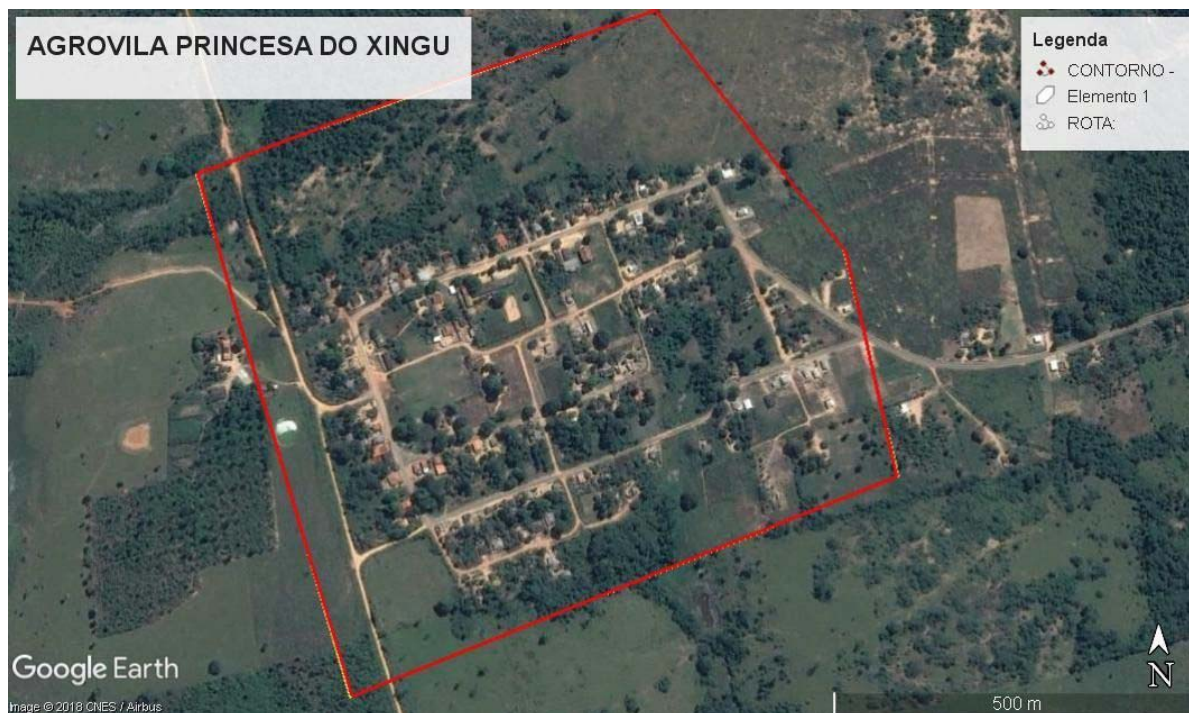
Figura 2 7

Minha primeira visita foi feita em um dia de semana pela manhã e percebi pouco ou nenhum movimento nas casas, quase todas estavam fechadas. O pouco movimento que percebi e do qual me recordo foi o da escola, uma vez que as aulas estavam normais e havia uma programação especial em comemoração pelo dia da criança. Algumas visitas mais tarde, chegaria à conclusão de que minha percepção inicial faria parte de um comportamento comum às vilas de agricultores da região que, durante a semana costumam trabalhar e dormir em seus locais de trabalho e, aos finais de semana, retornam as suas casas nas agrovilas para descansar e usufruir dos espaços da mesma.