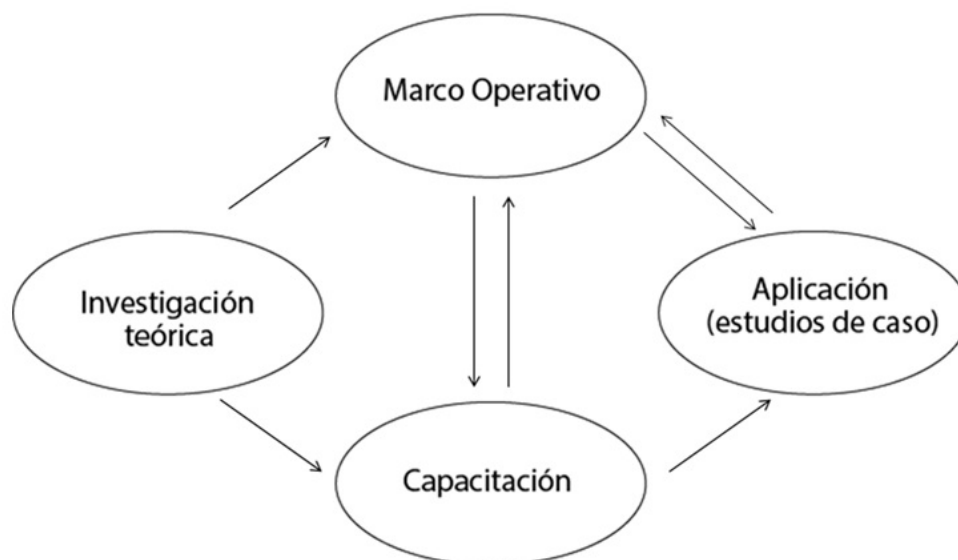
Figura 1. Los cuatro componentes metodológicos del programa MESMIS.