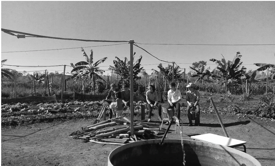
Figura 2 – Alunos da escola Jaraguá na área experimental. P.A. Jaraguá, Água Boa (MT).