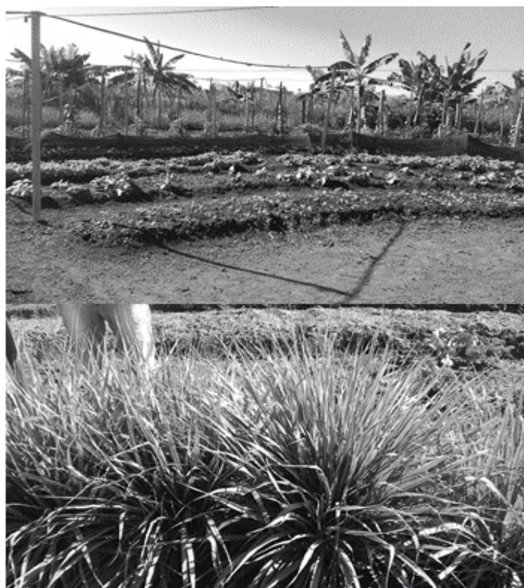
Figura 1 – Área experimental da Escola Estadual Jaraguá. P.A. Jaraguá, Água Boa (MT).

A Escola conta com uma área experimental (Figuras 1 e 2) situada ao lado do prédio Central, onde são desenvolvidos as aulas práticas e experimentos com os alunos. Os alimentos que são cultivados no local, são destinados para venda e preparo das refeições que são realizadas no refeitório com os alunos, professores e demais trabalhadores da escola.