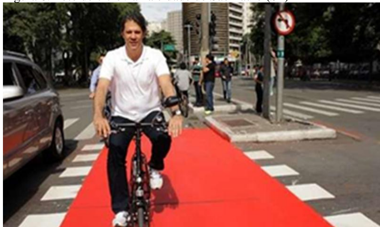
Figura 8. Foto de ciclovia na cidade de São Paulo (SP)