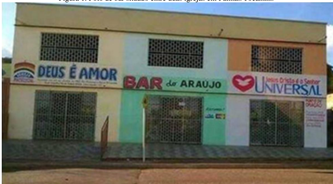
Figura 1. Foto de bar situado entre duas igrejas em Palmas/Tocantins

Disponível em: < http://www.e-farsas.com/bar-resiste-entre-duas-igrejas-o-bar-do-araujo-existe-mesmo.htm >. Acesso em: 01 jul. 2015.