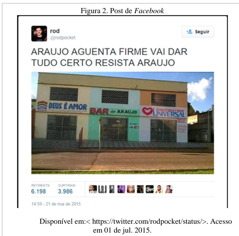
Figura 2. Post de Facebook

mais durável e salvacionista. O poder aparece conduzindo os sujeitos num espaço em que eles precisam se sentir livres, onde as práticas possam capturá-los ou os levarem à resistência, mas uma resistência não maior do que a constância das práticas do dispositivo. Assim, o espaço delimitado da cidade entra numa rede enunciativa, não como um documento da localização dos prédios, mas como monumento a integrar outros dispositivos. Como monumento passa a compor diferentes cenários e enunciados que respondem a algo antes e que suscitam outros enunciados como o do post (figura 2) publicado no Facebook : “Resista, Araújo!”. Araújo é o corpo que não aceita se moldar conforme as normas que asseguram a saúde, a longevidade, os bons costumes da moral cristã, a vida eterna. Mas é um corpo que se encontra acuado, cercado, sozinho, sem espaço para a luta diante do contingente da população que assina o contrato com o dispositivo.