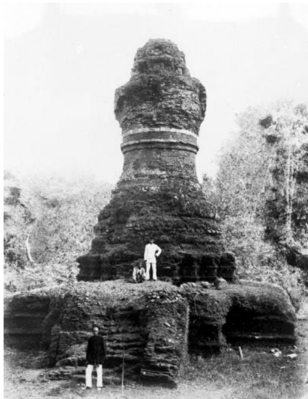
Stūpa Mahligai en Muara Takus, 1889.

A pesar de esta evidencia temprana, los restos arqueológicos y escasos documentos epigráficos, repartidos en lugares dispares de la isla - especialmente a lo largo del río Batang Hari por ejemplo Muara Jambi y Muara Takus- han producido restos de monumentos e inscripciones budistas que en su mayoría datan de del siglo X al XIII y que muestran rasgos tántricos. 21