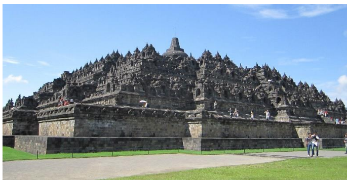
Borobudur, Java Central.