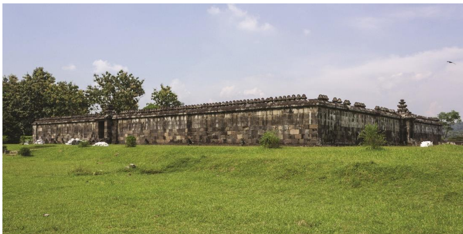
Caras norte y oeste de la pared prākāra alrededor de la estructura de doble plataforma, Ratu Boko, Java Central.

La fama del Abhayagirivihāra en Anurādhapura se extendió hasta el sudeste asiático. Como lo prueba una inscripción 17 en siddhamāṭṛkā del siglo VIII, los Śailendras construyeron una delegación del Abhayagirivihāra de Sri Lanka, aparentemente destinada para el uso de monjes budistas cingaleses de mentalidad esotérica, en el promontorio de Ratu Boko en Java Central; como lo demuestran Miksic (1993-94), Degroot (2006) y Sundberg (2004, 2011, 2016), las estructuras relacionadas con el Abhayagirivihāra de Ratu Boko comparten con sus prototipos cingaleses, es decir, algunas de las estructuras periféricas de Abhayagiri aparentemente poblados por monjes ascéticos, motivos arquitectónicos comunes, como plataformas de meditación doble.