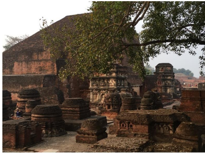
Stūpa de Sāriputta, Nālandā, Bihar.

Conectados a la ciudad portuaria de Pāla de Tāmralipti, Nālandā -y los otros centros budistas en la región noreste- eran fácilmente accesibles a través de las rutas marítimas que conectaban el litoral de la Bahía de Bengala, el sudeste de Asia y China.