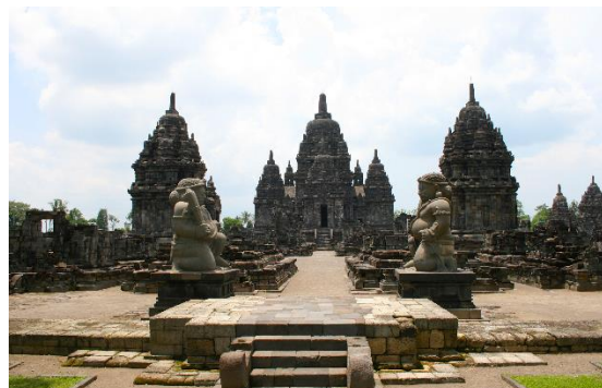
Candi Sewu, Java Central.

El manuscrito ilustrado del Aṣṭasāhasrikā-Prajñāpāramitā CUL Add. 1643 dedica una viñeta a una imagen del Buda Dīpaṅkara en Java. Como argumentó Sinclair (2016) sobre la base de la geografía tántrica expuesta por el Manjuśriyamūlakalpa (51.636-640), “a finales del siglo VIII, a Kaliṅgoḍra, el «Keliñ marítimo», se le había otorgado el reconocimiento de Buddhavacana en el mundo sánscrito”.