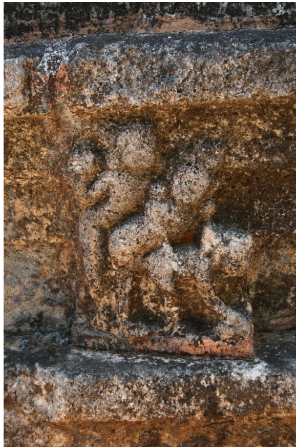
Relieve en Rājiṇāvihāra.

El templo - geḍigē - presenta relieves eróticos de carácter transgresor (Mudiyanse, 1967) (Chandawimala, 2013) y Dohanian (1977) se refiere a la existencia de una breve inscripción en Siddhamāṭṭkā del siglo IX encontrada cerca (Sundberg, 2016).