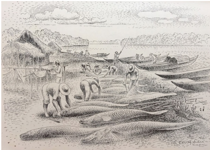
Figura 02 – Pesca do pirarucu