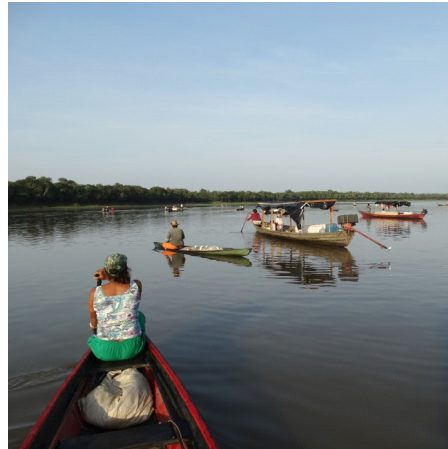
Figura 03 - Pesca no lago do Cleto, RDS Mamirauá.

A pesca inicia após a coordenação do projeto reforçar para todos os presentes 22 as regras que regem as atividades nos lagos manejados, e declarar aberta a pesca. Em seguida, todos se deslocaram rapidamente para o centro do lago à procura de um bom lugar para colocar as redes malhadeiras para fazer o lanço (Figura 03), que consiste em fazer um círculo com a rede. Trata-se de fazer recortes temporários do território comum, o lago, para realizar a exploração individual dos recursos pesqueiros. A equipe dona do lanço exercerá o controle dessa porção do território, cujo limite é estabelecido pela rede, pelo tempo que for necessário para capturar todos os animais que estiverem no cerco. Contudo, há situações em que os donos do lanço podem deixar que uma pessoa do mesmo grupo de parentesco pesque no seu lanço , caso ele tenha urgência em concluir sua pescaria, pois entendem que é um ato de reciprocidade, de ajudar a quem precisa.