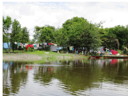
Figura 02 - Acampamento de pesca no cano do lago do Cleto. RDS Mamirauá.