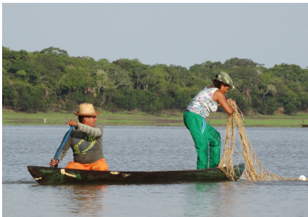
Figura 04 – Soltando a rede para fazer o lanço. Lago do Cleto, RDS Mamirauá.

Durante a pesca as decisões mais importantes geralmente são tomadas pela pessoa mais experiente, tais como escolher os locais onde será realizada a pesca, se vai usar a hástia ou a rede malhadeira, com a técnica do lanço . Como dito antes, na pesca nos lagos são usados dois tipos de canoas, uma maior para colocar os peixes e uma menor para facilitar o deslocamento dos pescadore(a)s dentro do lanço , e ao longo da rede. Estes se revezam na atividade de jogar a rede da água, que deve ser arrumada na canoa de modo que ao ser lançada na água ela fique aberta. A pessoa mais experiente direciona a canoa procurando fazer um círculo com a rede, e corrige quem está jogando a rede na água, em pé e curvada sobre a canoa (Figura 04). Este mesmo procedimento é repetido no momento de retirar a rede da água.