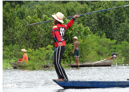
Figura 05 - Jovem pescando no lago do Cleto, RDS Mamirauá.

A pesca com hástia exige do pescador habilidade e destreza corporal, e é feita com o pescador posicionado em pé na proa da canoa, com a hástia levantada na altura da cabeça (Figura 04), atento aos movimentos ou boiadas dos peixes, para conseguir arpoá-lo quando ele sobe à superfície para respirar. O pescador tem poucos segundos para tomar decisões: ele precisa calcular rapidamente a direção que o peixe tomará ao submergir e, dessa forma, poder atirar a hástia com o arpão, pois se ele errar terá que esperar que este ou outro animal retorne à superfície, o que pode demorar cerca de 15, 20. Mas quando ele se sente encurralado pode demorar mais de 40 minutos para subir para respirar. Pela maneira como o peixe baterá com a cauda na água, o pescador saberá se ele está brabo ou manso (Castello 2004; Queiroz 2000; Sautchuk 2007), e assim calcular o tempo que ele vai demorar a subir novamente para respirar.