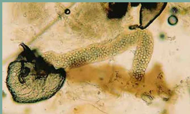
Met hulp van bijen@wur kan microscopisch amoëbe in de darmen gevonden worden.