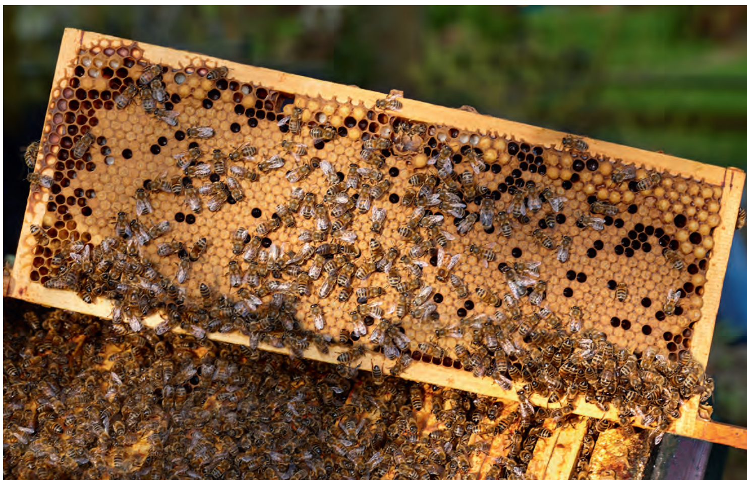
Honingkamerraam vol met broed.