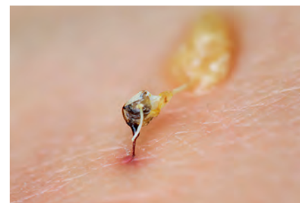
Angelapparaat vast in de huid geprikt.

roofdieren. De angel zet zich vast in de huid als een harpoen, en wanneer de bij wegvliegt, blijft die achter samen met het gifzakje, dat nog een tijd gif blijft pompen (zie foto). Intussen verandert ook het gedrag van de bij die gestoken heeft. Ze wordt roekeloos agressief in een poging de indringer te intimideren. Haar verdediging is verdubbeld: terwijl de angel zijn werk doet, is ze vrij om aanvullend verdedigend gedrag te vertonen tot zij overlijdt. Steken is het laatste redmiddel bij het verdedigen van de bijenkast. Het is voor een bijenvolk niet voordelig om deze stap onmiddellijk uit te voeren als er gevaar dreigt, als een mildere reactie de indringen ook op de vlucht kan jagen. De figuur geeft de verschillende stappen van het verdedigingsmechanisme van de bijenkast weer. Eén of meerdere werkbijen nemen het