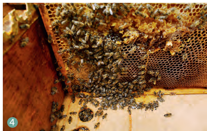
1. Zo'n raam is rijp voor de wassmelter. 2. Hetzelfde raam, maar met een deel van de verzegelde honing opengekrabd. 3. Een lege broedkamer op het volk en het voergat in de dekplank open. 4. Het opengekrabde voer wordt snel gevonden. De bijen gaan de schade herstellen.

Tegenwoordig bestaat het idee dat het allemaal best veel later kan omdat het vaak tot ver in oktober mooi weer is en warm genoeg om het bijenvolk de aangeboden suiker te laten opnemen. Dat is misschien wel zo, maar het ontwikkelingsprogramma van het bijenvolk is nog steeds hetzelfde. Na half augustus worden de broednesten snel kleiner en neemt het aantal bijen in de volken af. Het lijkt mij dat het voor een bijenvolk gemakkelijker is om suikervoorraden te verteren en op te slaan als het nog een groot volk is. Of laat in het jaar voeren ten koste gaat van de levensduur van winterbijen is mij niet bekend. Het omzetten van voer (met invertase) neemt in ieder geval energie. Idealiter wordt die omzetting gedaan door de laatste zomerbijen.