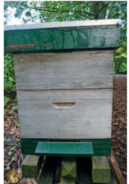
Na afname van de zomerhoninggoogst staat het volk weer op twee broedkamers.

uitlopen staan. Door het broed enkele dagen later weg te nemen, hebben de mijten 5-6 dagen meer tijd om in de val te stappen. Dat maakt deze werkwijze naar mijn mening effectiever. Het broed van de tweede serie is nog niet gesloten als de koningin wordt bevrijd. Het vrijlaten van de moeder en het wegnemen van de vangramen kan daarom niet tegelijkertijd gedaan worden. Dat broed moet wat later, uiterlijk 20 dagen na het inhangen, worden weggenomen. De raampjes met gesloten broed leveren in de zonnemelting nog aardig wat was op.