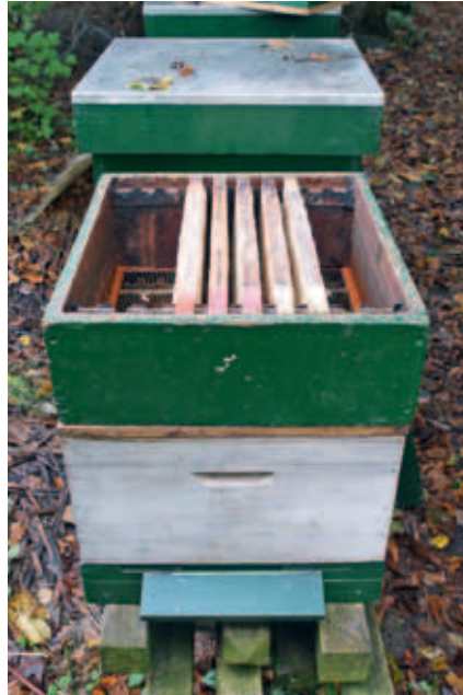
In de lege honingkamer worden vijf uitgebouwde raampjes gehangen. De lege plaatsen kunnen worden opgevuld met lege raampjes.