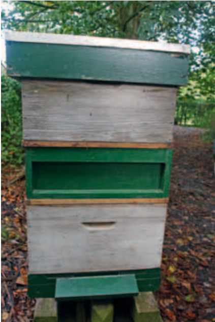
De koningin zit tussen twee roosters in de centraal geplaatste honingkamer. Na enige tijd vindt de varroamijt alleen nog in deze honingkamer rijpe larven om bij in te stappen.