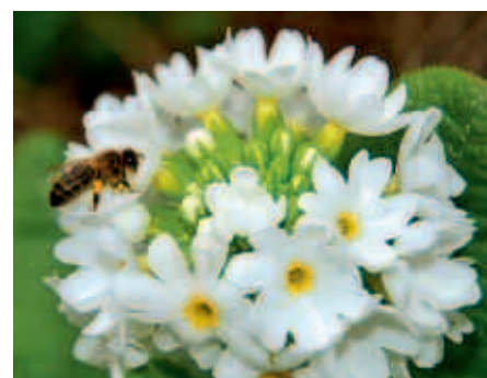
5 Primula denticulata alba : bol- of kogelprimula; een cultivar van de echte sleutelbloem