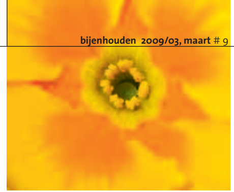
6c Het stuifmeel van bloemtype B wordt door allerlei bestuivers overgebracht naar bloemtype A

rozet komt een rechte, korte bloemsteel omhoog, waarop een scherm met naar één zijde knikkende bloemen staat. Van die bloemen is de kelk lichtgeel, breed en klokvormig. De kroon is donkergeel. De vijf, soms diep ingesneden slippen aan het einde van de kroonbuis vormen een kommetje, terwijl de keel oranje vlekken heeft (afbeelding 3). De plant is inheems in heel Europa en Azië en gedijt op vochtige plaatsen: weilanden, open velden en kuststreken. De bloeitijd van april tot juni is iets later dan die van de volgende twee soorten. Toch heet zij Primula veris = 'eerstelingetje van de lente'. Oudemans noemt haar nog Primula officinalis , vanwege het geneeskundig gebruik. Vaak is er een tweede bloei in de herfst. De cultivars kunnen behalve geel ook andere kleuren hebben.