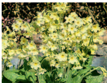
3 Primula veris : gulden sleutelbloem, ook echte sleutelbloem genoemd

Primula veris : de gulden sleutelbloem, een betrekkelijk lage lentebloeier (ook gewone of echte sleutelbloem geheten). Uit de