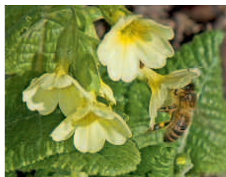
4 Primula vulgaris : stengelloze sleutelbloem