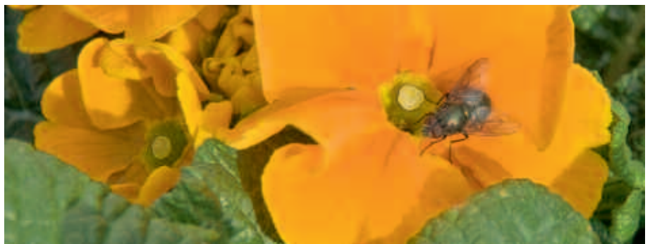
8 Deze vlieg bereikt het stuifmeel halverwege de kroonbuis niet