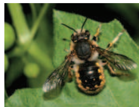
Mannetje grote wolbij.