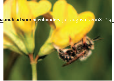
Mannetje kleine wolbij.

andoornsoorten favoriete drachtplanten. Betonie is daarbij als tuinplant bijzonder aan te bevelen. Hartgespan hoort ook tot de zeer graag bezochte planten, evenals gamandersoorten. Maar de grote wolbijen tref je ook wel aan op vingerhoedskruid en op vlinderbloemige planten. Zoals bij alle wolbijsoorten het geval is, verzamelen vrouwtjes van de grote wolbij het bijna witte stuifmeel aan buikharen. Om energie bij te tanken zie je ze ook op sedumsoorten als huislook drinken. Wolbijen kennen maar één generatie per jaar.