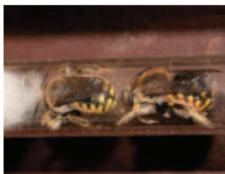
Nestgang door grote wolbij met plantenharen gevuld.

Grote wolbijen geven de voorkeur aan roze lipbloemen. De wollige andoorn is dubbel favoriet bij de vrouwtjes, omdat die ook nestmateriaal levert. Bij deze plant zijn ook de mannen heel vaak te vinden om ijverige vrouwen te overvallen. Het knagen van haren gebeurt gewoonlijk aan de onderkant van de bladeren, of aan de stengels. Bij prikneus aan de onderkant van de bloemhoofdjes. Verder zijn alle