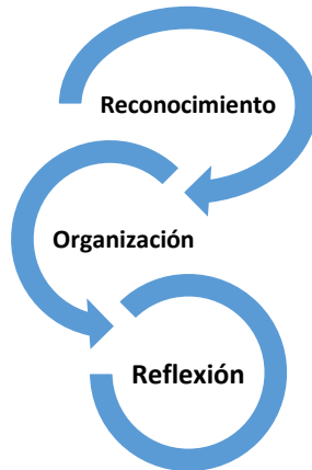
Figura 1. Representación de la fase de indagación diagnóstica del GET

Los investigadores, al hacer parte del cuerpo docente de la Institución Educativa Rafael Núñez y atendiendo lo que por observación directa se apreciaba, así como los resultados académicos y las correspondientes discusiones generadas en cuanto a las formas de orientar las clases; pudieron determinar que existía una problemática en cuanto a las prácticas de lectura en la escuela. Asimismo, se pudo plantear la posibilidad de relación existente entre las prácticas de lectura y el escaso hábito lector de los estudiantes de básica primaria. Luego de varias sesiones se obtiene como resultado que al generar prácticas de lectura aisladas, disfuncionales y tradicionales no se habían podido mejorar los resultados en los estudiantes desde la perspectiva de comprensión lectora, y mucho menos, que fomentaran el deseo por la lectura.