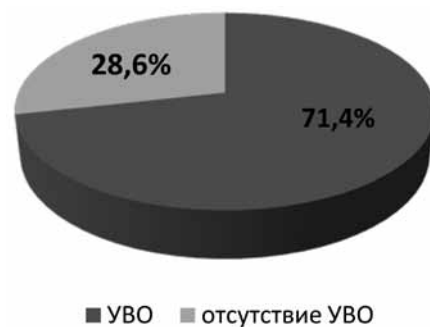
Рис. 2. Частота УВО при применении тройной схемы ПВТ, включающей симепревивер, цеПЭГ-ИФН альфа 2b и рибавирин, n = 21

При применении тройной схемы ПВТ, включающей симепревивер, цеПЭГ-ИФН альфа 2b и рибавирин, на 4-й и 12-й неделях терапии HCV РНК не определялась у 90,9% пациентов (n = 20). Полный запланированный курс лечения завершил 21 пациент. Из них 71,4% пациентов (n = 15) достигли УВО (рис. 2).