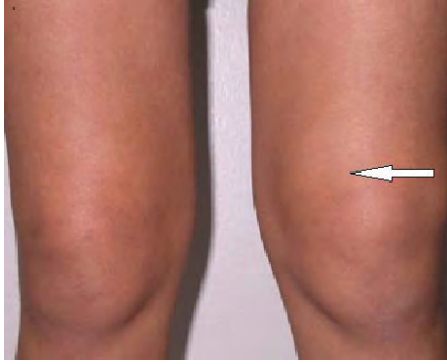
Рис. 1. Отечность мягких тканей в области левого коленного сустава (август 2014 г.)

Через 6 месяцев от начала заболевания пациентка была госпитализирована на ревматологическое отделение Санкт-Петербургского государственного педиатрического медицинского университета с диагнозом «Монартрит левого коленного сустава». При обследовании клинико-лабораторные показатели (клинический анализ крови, общий белок, АЛТ, АсТ, билирубин, сахар крови, ревматологические пробы) были в пределах нормы. На магнитно-резонансной томографии коленного сустава определяли неоднородное содержимое в проекции препателлярной сумки, распространяющееся на передне-латеральную поверхность, с четкими контурами, размером 50×8 мм.