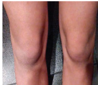
Рис. 3. Отсутствие патологических изменений коленного сустава

С диагнозом «Актиномикоз левого коленного сустава, состояние после оперативного лечения» пациентка поступила в микологическую клинику СЗГМУ им. И.И. Мечникова. Клинико-лабораторные показатели оставались в пределах нормы. Проведено лечение бензилпенициллином натриевой солью в дозе 8 млн ЕД в сутки в течение 10 дней (по 2 млн ЕД внутривенно 4 раза в сутки). Отмечали положительную динамику в виде уменьшения боли и увеличения объема движения в левом коленном суставе. В последующем пациентке был назначен амоксициллин в дозе 750 мг в сутки перорально. Через 3,5 месяца от начала лечения при контрольном осмотре общее самочувствие больной было удовлетворительное. Болевой синдром отсутствовал, объем движения левого коленного сустава был сохранен в полном объеме, показатели клинико-диагностических исследований были в пределах возрастной нормы (рис. 3). На магнитно-резонансной томографии области коленного сустава костно-травматических изменений в зоне сканирования выявлено не было.