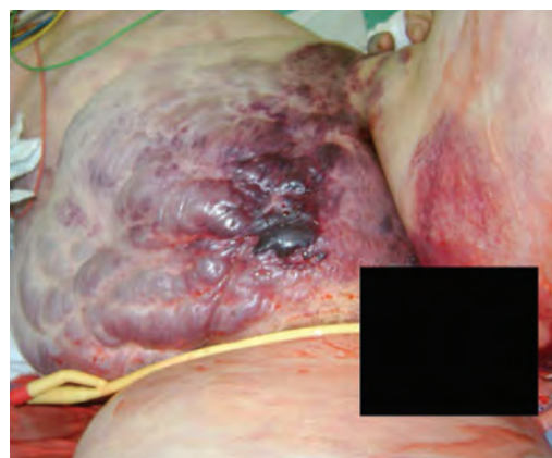
Рис. 3. Нарастание повреждения кожи в течение 4 часов от начала лечения септического шока

Проводилась вспомогательная вентиляция легких через лицевую маску с постоянным положительным давлением в дыхательных путях 5 см вод. ст., поддержкой положительного давления вдоха и содержанием кислорода в дыхательной смеси 100%, что позволяло поддерживать сатурацию артериальной крови на уровне 97–99%. В анализах крови, полученных к этому времени, выявлялась выраженная лейко- и нейтропения ( 0,71 \times 10^9/\text{л} и 0,04 \times 10^9/\text{л} соответственно), тромбоцитопения ( 11 \times 10^9/\text{л} ) и тяжелый негазовый ацидоз (в смешанной венозной крови pH 7,1; SBE «–» 19,9; лактат 6 ммоль/л). Проводившаяся в последующие часы коррекция ацидоза и тромбоцитопении (донорскими тромбоцитами), а также общепринятая интенсивная терапия септического шока и остро-го респираторного дистресс-синдрома успеха не имели. Быстро прогрессировало нарушение сознания, что потребовало проведения механической искусственной вентиляции легких. Диурез отсутствовал. Буллезно-геморрагические изменения кожи нарастали (рис. 3, фотография выполнена через 4 ч после поступления в отделение реанимации и интенсивной терапии). Пациентка погибла в течение 6,5 ч от момента госпитализации.