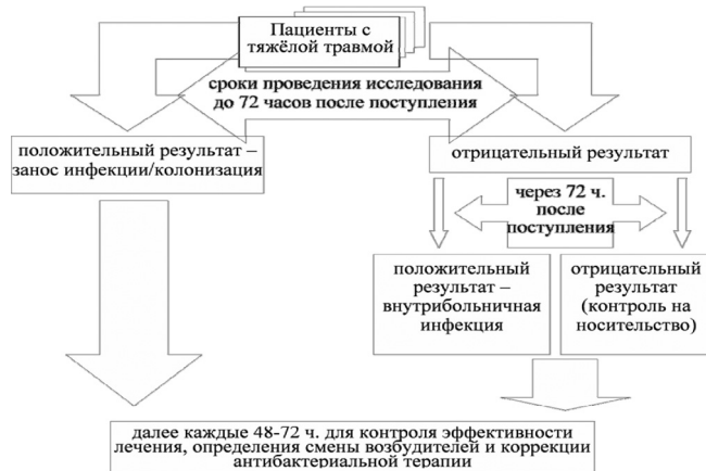
Рис. 2. Алгоритм обследования пациентов с тяжёлой травмой в ранние сроки после поступления в специализированный стационар

Полученные данные послужили основанием для разработки алгоритма микробиологического обследования пострадавших с тяжёлыми травмами с целью своевременного назначения и коррекции антибактериальной терапии (рис. 2).