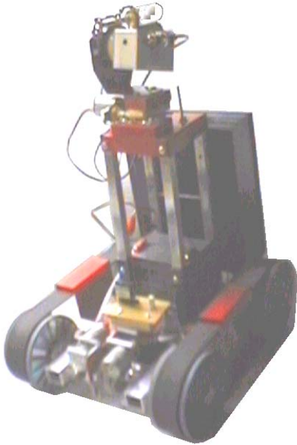
Figura 5. Robot móvil teleoperado I

En la Universidad Nacional se tiene cuenta del desarrollo del robot móvil teleoperado I (RMTO I), mostrado en la figura 5 [4].