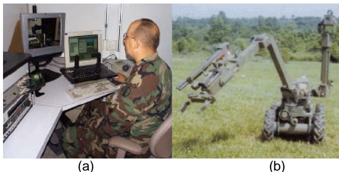
Figura 1. Componentes de un sistema teleoperado (a) Estación de teleoperación, (b) Robot (esclavo), adaptado de [1]

Un sistema teleoperado se compone principalmente de una estación de teleoperación, un sistema de comunicación y esclavo, el esclavo puede ser un manipulador o un robot móvil equipado con un manipulador ubicado en un entorno remoto como el robot Andros Wolverine de la empresa Remotec que se ilustra en la figura 1. La estación de teleoperación permite controlar al esclavo a distancia por medio del sistema de comunicación, el cual permite transmitir las señales de control hacia el esclavo y, a su vez, recibir señales de información sobre el estado de éste en la estación de teleoperación a través de un canal de comunicación que puede ser una red de computadores, un enlace de radio frecuencia o microondas.