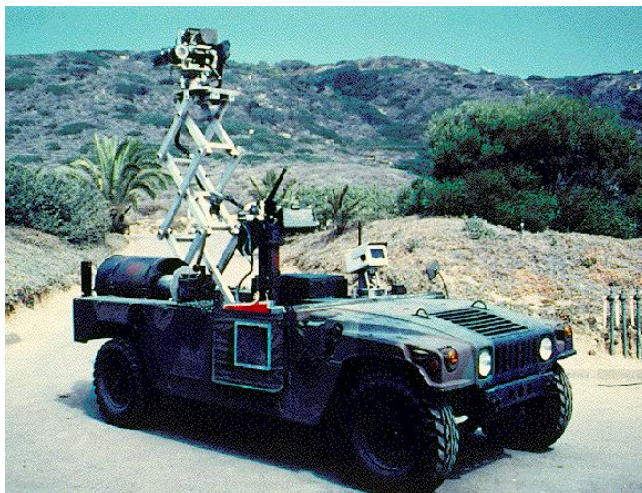
Figura 3. Vehículo teleoperado USMC

Un ejemplo, es el vehículo teleoperado USMC (US Marine Corp) desarrollado por la compañía Spawar Systems Center (SSC) de San Diego como parte del programa Ground Air TeleRobotic Systems (GATERS) bajo la dirección de la Unmanned Ground Vehicle Joint Program Office (UGV/JPO) ver figura 3. Compuesto principalmente de tres módulos: movilidad, vigilancia y armas y provisto de cámaras de video y micrófonos para lograr telepresencia [7][15][26].