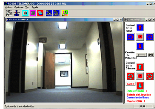
Figura 6. Software para la estación de teleoperación del RMTO I

Este robot es controlado a distancia desde una estación de teleoperación mediante un enlace de radio frecuencia, la imagen proveniente de una cámara ubicada en el robot es transmitida de manera inalámbrica a la estación de teleoperación. En la estación de teleoperación se encuentra un software desarrollado en lenguaje C++ que permite observar la visión del robot y enviar comandos al robot. La interfaz gráfica del software desarrollada para el manejo del robot está compuesta de dos ventanas, una para el despliegue del video proveniente de la cámara del robot y la otra para seleccionar los comandos de control. Una característica importante de este software es permitir el manejo del móvil usando una palanca de juegos (joystick o gamepad), el ratón o el teclado, en la figura 6 se puede observar la interfaz gráfica de usuario del mismo: