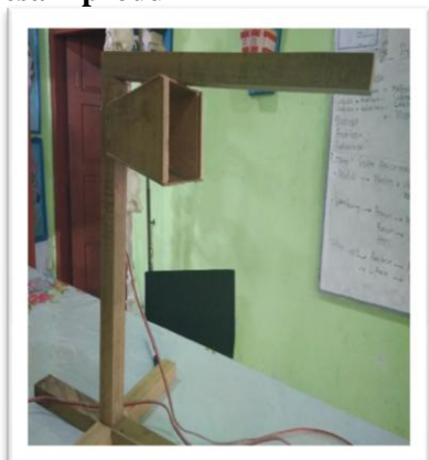
Gambar 1. Desain Produk