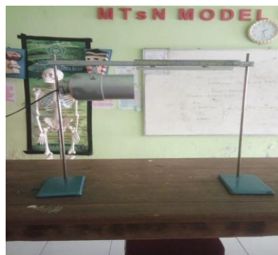
Gambar 2. Sebelum dirangkai Gambar 3. Sesudah dirangkai