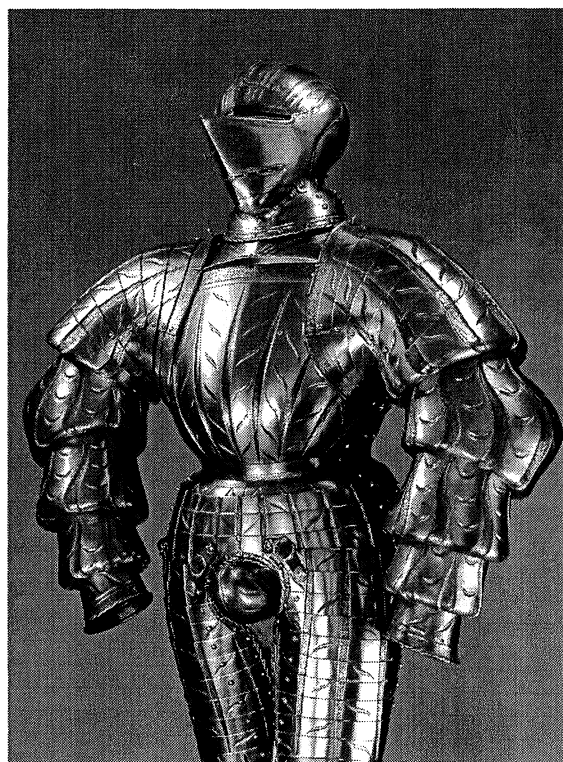
Fig. 2. Armadura de Wilhelm von Rogendorf, alrededor de 1525 ( Museo de Bellas Artes, Viena, Hofjagd- und Rüstammer, Inv. A 374 ).