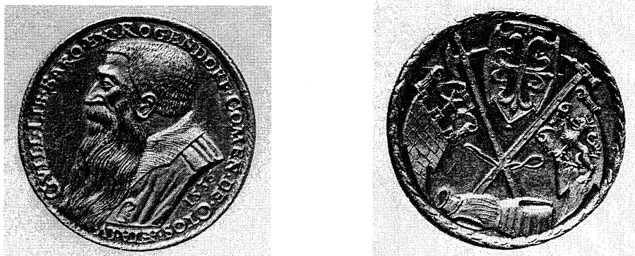
Fig. 1. Moneda con la efigie de Wilhelm von Rogendorf ( Museo de Bellas Artes, Viena, Münzkabinett, Inv. 14579 bB ).