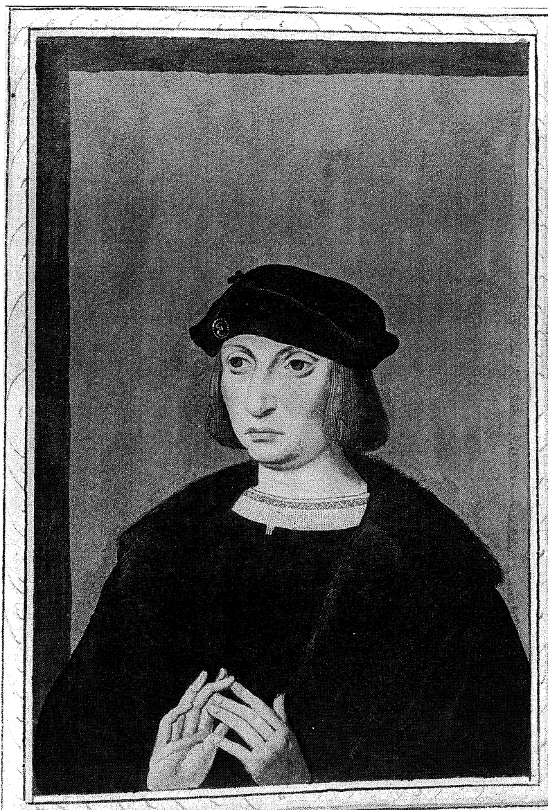
Fig. 3. Retrato de Wilhelm von Rogendorf. Portraitbuch (Libro de retratos) de Hieronymus Beck von Leopoldsdorf ( Museo de Bellas Artes, Viena, Gemäldegalerie, Inv. GG 9691 fol. 357 ).