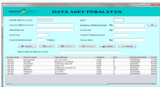
Gambar 4. Tampilan Form Peralatan

Adapun desain form data aset tetap peralatan dapat dilihat pada gambar dibawah ini :