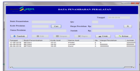
Gambar 5. Tampilan Penambahan

Adapun desain form data penambahan aset tetap peralatan dapat dilihat pada gambar dibawah ini: