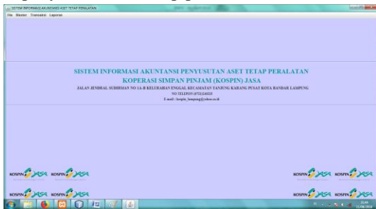
Gambar 3. Tampilan Menu Utama