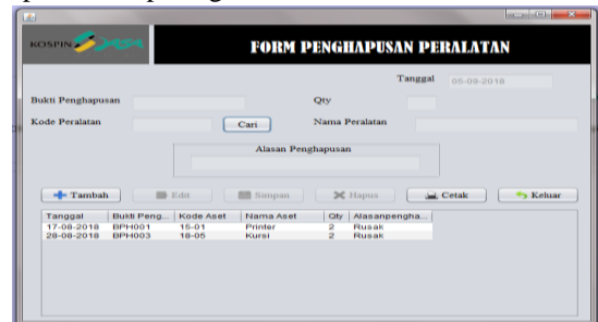
Gambar 6. Tampilan Form Penghapusan

Adapun desain form data aset tetap peralatan dapat dilihat pada gambar dibawah ini: