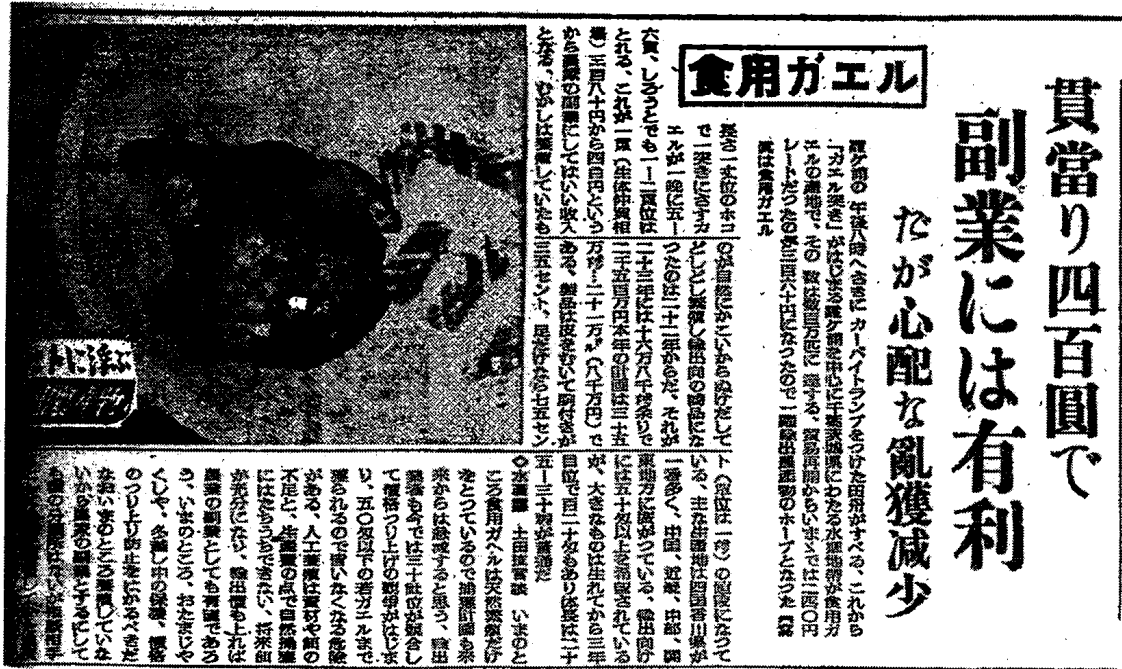
図1 昭和24年5月13日、『日本農業新聞』

を持ち込んだ（輸入した）のは、東京帝国大学教授の渡瀬庄三郎 (4) であるが、どのような目的で、いつ、輸入したのかをめぐっては混乱が見られる。