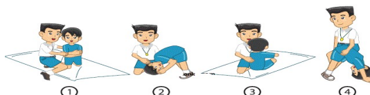
Gambar 3 Cara Memberikan Bantuan Guling ke Depan