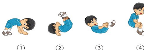
Gambar 1 Cara Melakukan Gerakan Guling Depan dari Sikap Awal Jongkok