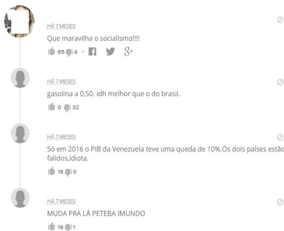
Figura 3: Comentário no portal G1