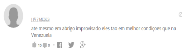
Figura 2: Print Comentário no portal G1

anteriores em que os brasileiros iam muito ao país vizinho, seja para aproveitar as condições econômicas favoráveis, como para turismo, ou até mesmo em busca de melhoria na qualidade de vida. Não tão diferente da atual situação dos venezuelanos.