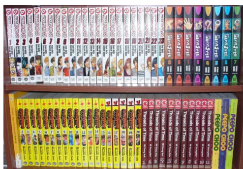
Figura 01: Imagens de produção de HQs

desenvolveram ao largo e no interior das produções das outras artes, desde obras e personagens criados para o mundo infantil até a citação e o trabalho produzido com o cânone literário e filosófico dos mundos ocidental e oriental.