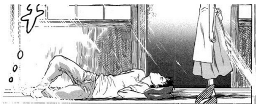
Figura 02 – (mangá) The wedding even.

As características do jousei são desenhos mais leves, com cenários mais suaves, traços leves e harmoniosos, como mostra a imagem abaixo: