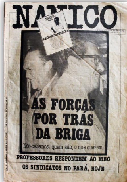
Figuras 4 e 5: Edições nº 4 de abril de 1980 e nº 8 de maio de 1981.