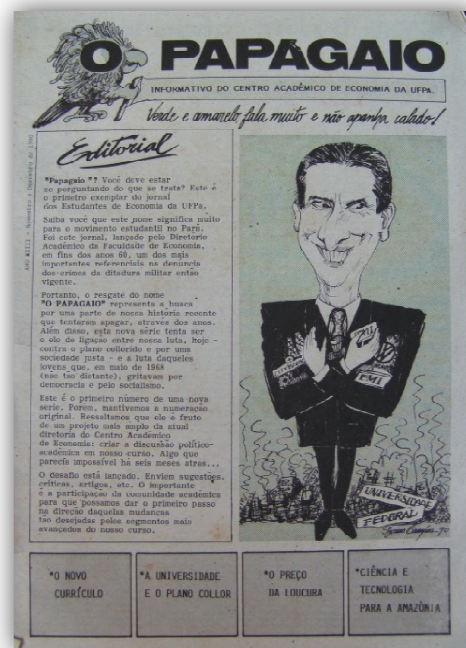
Figuras 2 e 3: Edição nº3, lançada em 22 de fevereiro de 1968, e edição nº 1, ano XXIII de 1990.