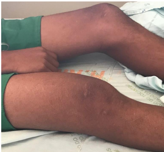
Figura 1. Massa flutuante grande que envolve a porção posterior distal da coxa direita, pele intacta apresentando aspecto eritematoso.

Um grande volume de material purulento foi drenado após a incisão cirúrgica da região do abscesso, seguido do desbridamento do tecido muscular necrótico. As culturas do material de abscesso da coxa direita revelaram S. aureus com perfil multi-suscetível, resistente apenas a penicilina. O tratamento com antibióticos apresentou boa resposta clínica.