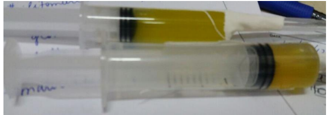
Figura 2. Amostra de líquido sinovial aspirado do joelho direito.

anemia, leucocitose (desvio para a esquerda), taxa de sedimentação dos eritrócitos e reagentes de fase aguda elevados. As culturas de sangue podem ser positivas variando de 5% a 10% nos trópicos para 20-30% em regiões temperadas. Os níveis séricos de enzimas musculares, como aldolase e creatina fosfoquinase, podem ser ligeiramente aumentados 12 .