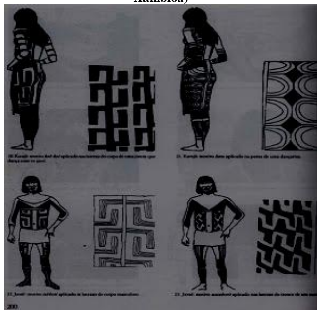
Figura 02: Grafismo do Povo iny (Karajá, Javaé e Xambioá)

Esses novos grafismos ainda não receberam nomes, nem classificações juntamente com suas distribuições. As classificações e suas respectivas distribuições dividem-se em: Masculino ( weryry, jyré, bódu, weryry bó, jyý tyhỹ ) e Feminino ( ijadomỹ, e hawyý ). Os encarregados de nomear, classificar e fazer a distribuição das pinturas na cultura é os anciões, por ser considerada a autoridade acima dos demais membros da aldeia.