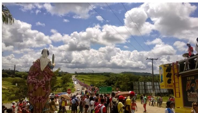
Figura 2: Peregrinos diante da Estátua de Santa Luzia em 2014

O enredo da celebração apresenta-se imbricado do liame de práticas aparentemente antagônicas, como a ginástica, os trios elétricos, as missas e o terço dos homens, mas que são utilizadas no intuito de promover a aglutinação de diferentes atores sociais e de reatar os laços devocionais e identitários da comunidade com os lugares santos. Outra questão importante presente na programação de 2013, é a forma pela qual o poder público municipal utiliza-se da nova expressão religiosa vinculada à cidade para implementar a sua potencialidade turística. Com isso, a Prefeitura Municipal custeou a construção de uma estátua de Santa Luzia na entrada da cidade. Reifica-se a devoção e o potencial da urbe como centro de romaria. Observe a Figura 2 3 :