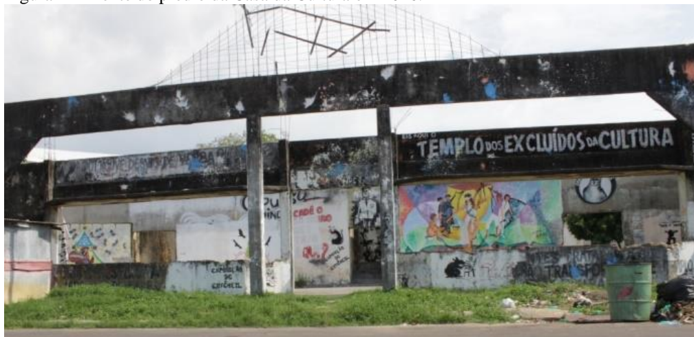
Figura 1 – Frente do prédio da Casa da Cultura em 2016.