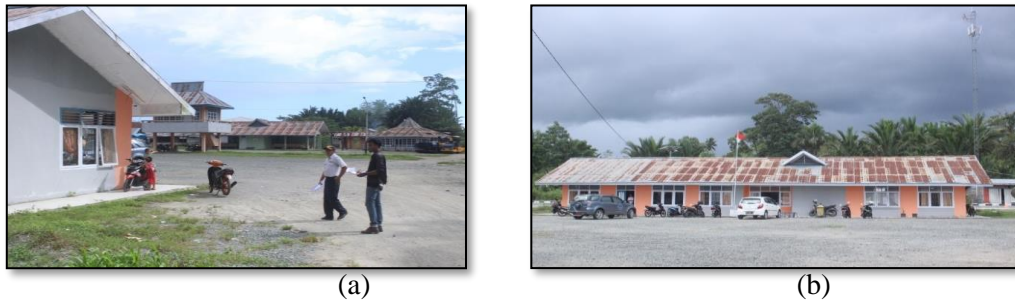
Gambar 4. (a) Kondisi ketersediaan ruang tunggu bagi pengguna jasa terminal (b) Kondisi kantor pengelola Terminal

Halmaherah Selatan agar bisa di renofasi kembali pada bagian Infrastruktur yang rusak, sehingga kondisinya tidak memperhatikan bagi pengguna jasa terminal.