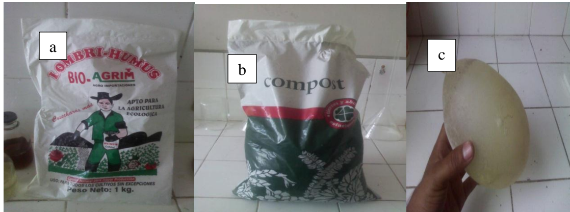
Fig. 1. Material utilizado en la experiencia: a. humus comercial, b. compost comercial, c. membrana semipermeable artesanal (vejiga de chancho).

El material de estudio estuvo constituido por relave proveniente de las relaveras de Samne, provincia de Otuzco, región La Libertad, Perú; asimismo de piedra caliza, compost y humus los que se obtuvieron de proveedores comerciales y membrana semipermeable artesanal de vejiga de cerdo (Fig. 1), obtenida del camal municipal del distrito de El Porvenir, Trujillo.