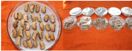
Figura 1. Germinación de semillas de P. rohrii en placa de Petri cubierta con papel aluminio y descubierta.

El ensayo de germinación constituye una herramienta eficaz para establecer calidad de lotes de semillas, sin embargo no todas las especies responden al mismo estímulo ante la presencia de luz u oscuridad, como el caso de P. rohrii (Tabla 1 y Figura 1). Investigaciones que tuvieron el mismo objetivo, pero empleando semillas de Paspalum guenoarum , demostraron que tanto la temperatura, como la luz son determinantes en la expresión del máximo potencial germinativo de dicha especie. Por otro lado otros estudios han demostrado que ante luz permanente a 20 °C, se presenta una mejor germinación de Nolina parviflora , mientras que a mayores temperaturas decrece linealmente (Reyes y Rodríguez, 2005; Otegui et al., 2005).