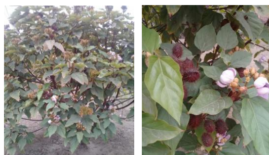
Figura 1. Arbusto con flor y fruto de Bixa orellana L.

Los frutos fueron seleccionados y transportados al Laboratorio de Biotecnología del Instituto de la Papa y Cultivos Andinos de la Universidad Nacional de Trujillo (Figura 2), en donde se registró el peso de cápsulas y semillas (Figura 3), y se midió la longitud y ancho (Figura 4).