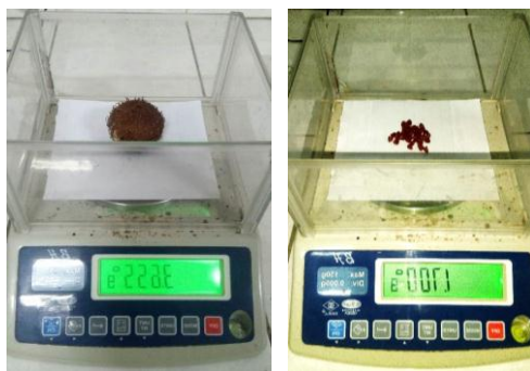
Figura 3. Pesado de fruto y semillas de Bixa orellana L. "achiote".