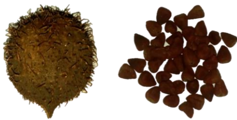
Figura 2. Fruto y semillas de Bixa orellana L. "achiote".