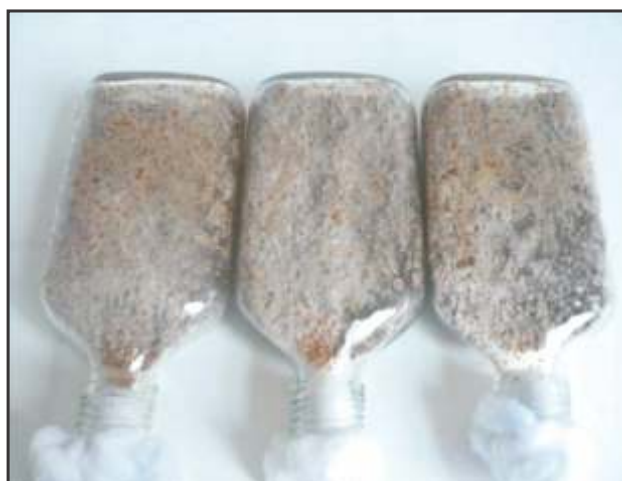
Fig. 3. Crecimiento micelial de P. lilacinus en salvado de trigo a pH 7