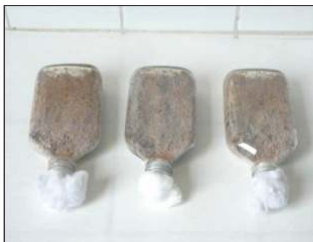
Fig. 4. Crecimiento micelial de P. lilacinus en salvado de trigo a pH 9