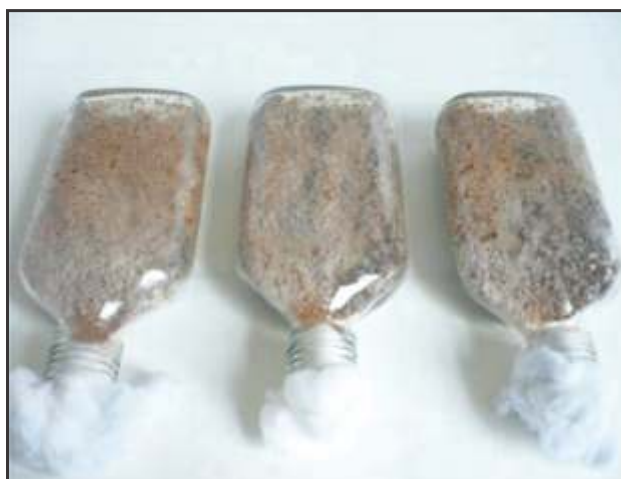
Fig. 2. Crecimiento micelial de P. lilacinus en salvado de trigo a pH 5