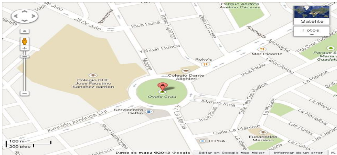
Fig. 2. Plano de las calles cercanas a la I.E “JOSÉ F. SÁNCHEZ CARRIÓN” .