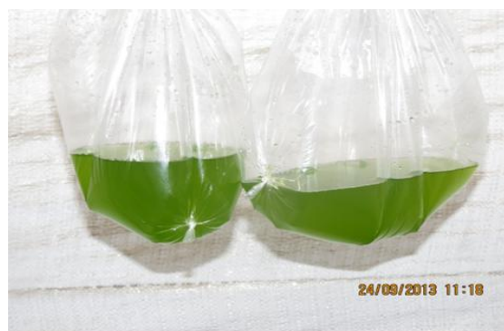
Fig. 3. Prueba del medio nutritivo de residuos de anchoveta en el crecimiento de Chlorella Vulgaris