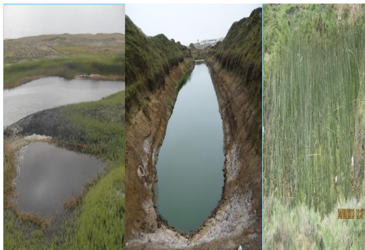
Fig. 1. Recolección de la muestra de espirulina A. jenneri en los humedales de ambiente natural El Tubo (izquierda), ChouChou (centro) y Huanchaco (derecha) en Malabrigo, Salaverry y Huanchaco.

Luego se realizó el cultivo de 1 L de espirulina con las condiciones de salinidad, pH y temperatura del ambiente natural por 15 días en un set de baterías de botellas de 2,5 L con un inóculo algal de 100 ml e identificadas con concentraciones correlativas de 1 a 15 ml. Posteriormente se seleccionaron las concentraciones de 5, 10 y 15 ml de residuos de anchoveta para determinar los parámetros de densidad y crecimiento.