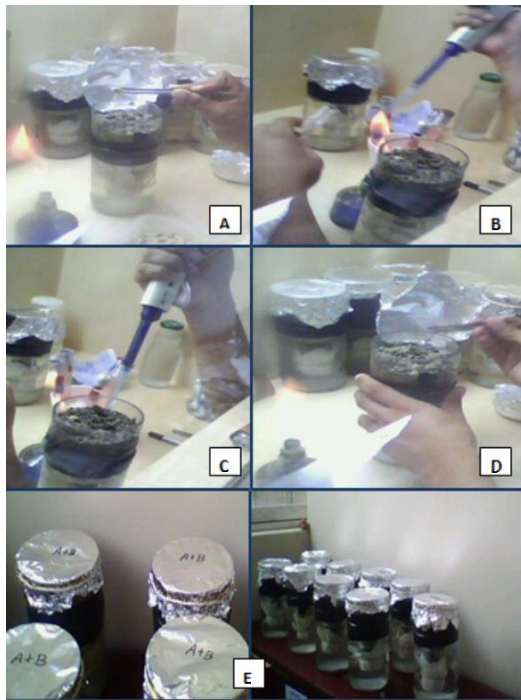
Figura 1 Siembra e inoculación A. siembra de semilla B. toma de inóculo estandarizada C. inoculación a la semilla D. tapado de la semilla con arena E. jarras inoculadas.

Bradyrhizobium sp. CIAT 71 y a la otra 0, 5 mL de inóculo de Bradyrhizobium sp. RC-458-01. Posteriormente se cubrió cada semilla con arena y con su tapa respectiva de papel aluminio; esta tapa se retiró cuando las plántulas obtuvieron 2 cm de altura (Somesegaran y Hoben, 1994).