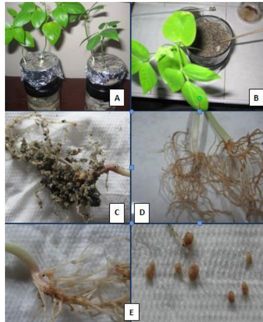
Figura 2. Obtención de los nódulos A. plantas de Caupí después de 40 días de crecimiento B. Extracción de las raíces de Caupí D. lavado de las raíces E. obtención de los nódulos.

Una semana después de la siembra se evaluaron cada una de las plantas presentes en las jarras, eligiendo a las dos mejores, luego se procedió a cubrir la superficie con arena parafinada estéril. Posteriormente se colocaron las jarras en casa de malla durante 40 días; durante este tiempo se procedió a corregir periódicamente el nivel de solución nutritiva, además se reguló la temperatura ambiental y humedad relativa (Hungria et al. , 2000). Luego, de los 40 días de crecimiento de la planta, se procedió a la separación de la raíz y lavado de los nódulos de Caupí. Los nódulos se colectaron en bolsas pequeñas de polietileno; se utilizó una bolsa por cada planta, seguidamente se procedió a sellar y etiquetar cada bolsa (Somesegaran y Hoben, 1994).