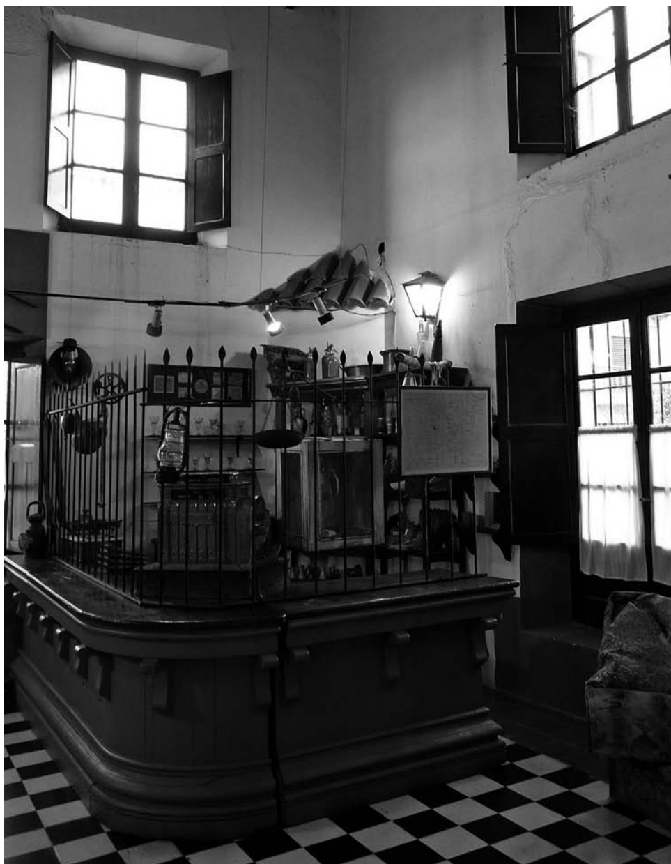
Foto 15. Museo Etnográfico y Archivo Histórico «Enrique Squirru» de Azul. Reja y mostrador de pulpería (1890). Foto: Jesús Bustamante, agosto de 2011.