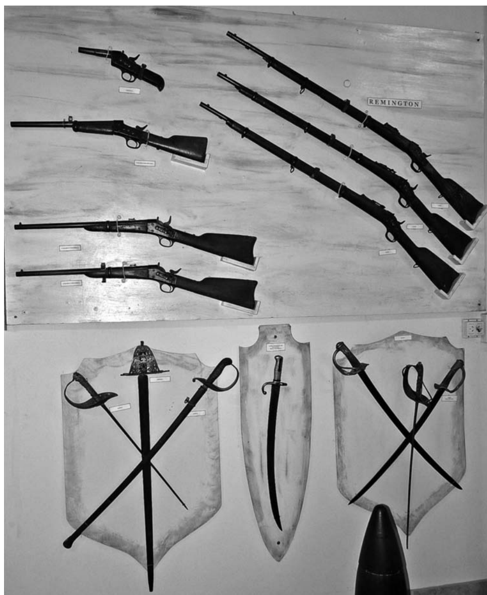
Foto 6. Museo Casa de Cultura de Tapalqué. Breve muestra de la colección de armas. Foto: Federico W. Mauriño, agosto de 2011.