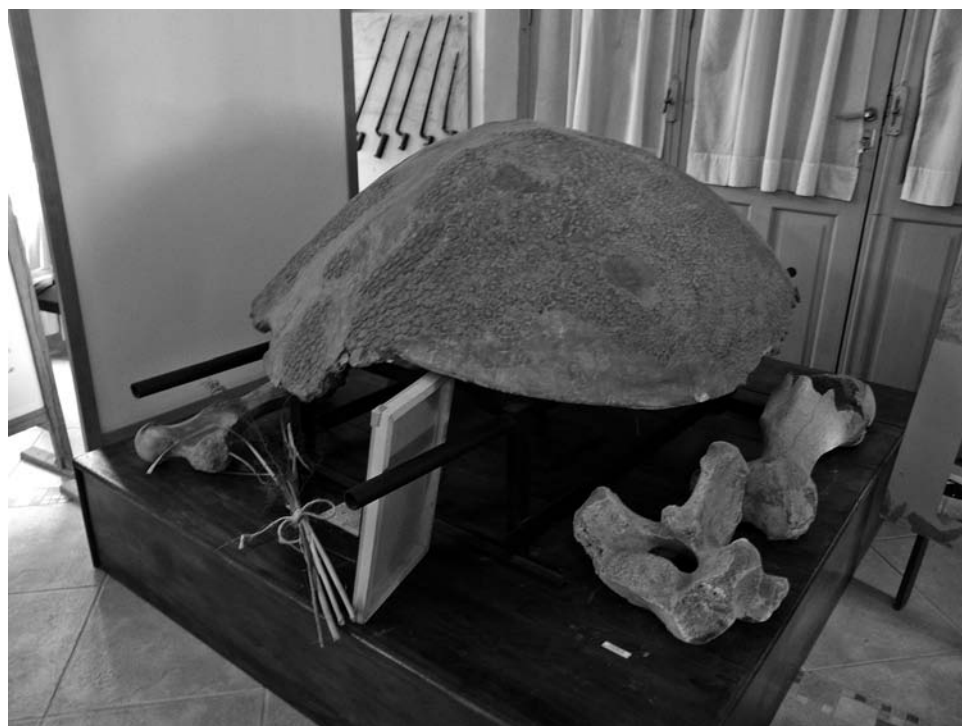
FOTO 4. Museo Casa de Cultura de Tapalqué. Caparazón de gliptodonte. Foto: Jesús Bustamante, agosto de 2011.

En el caso de Tapalqué dos características son destacables: la exhibición de una magnífica colección de armas, desde las usadas en las guerras de Indepen-