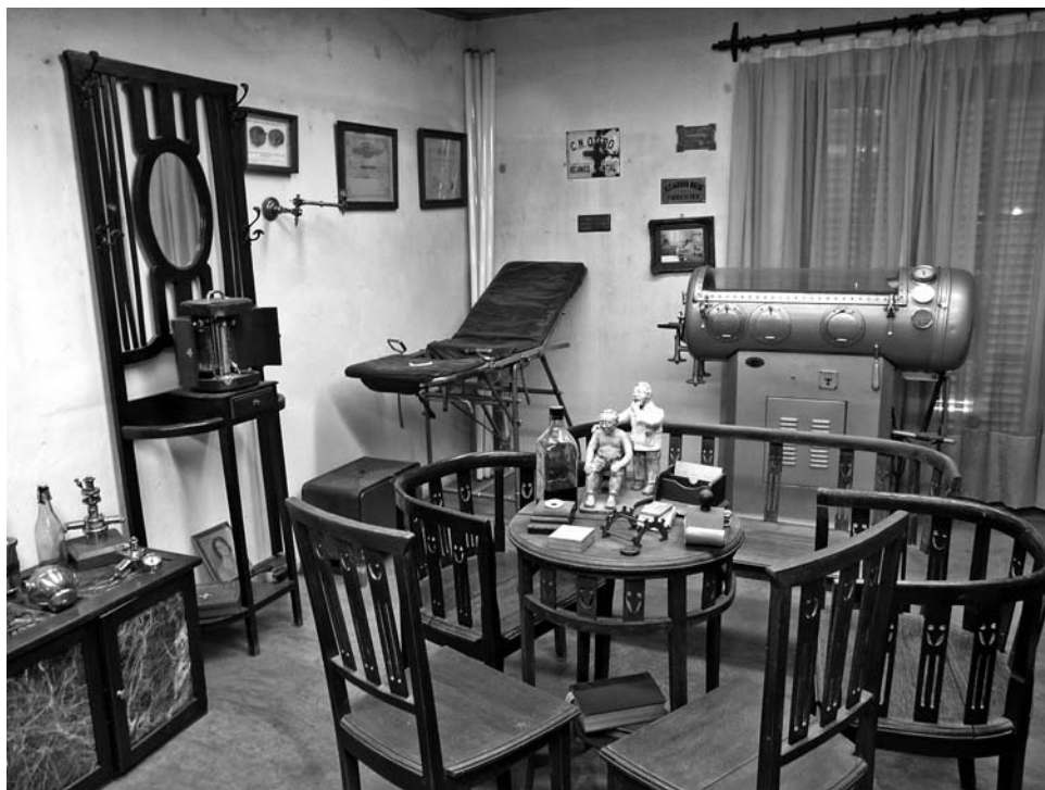
Foto 3. Museo «Julio de Vedia» de la ciudad de 9 de Julio. Instrumentos de medicina utilizados en la localidad entre finales del siglo XIX y primeras décadas del XX (entre ellos, una incubadora). Foto: Jesús Bustamante, agosto de 2011.

carbono 14 dio como resultado que dichos restos se remontaban a más de 10.000 años de antigüedad. Con el tiempo se han identificado seis sitios arqueológicos además de un sitio histórico, el antiguo Fortín General Paza, donde hubo asentamientos de indios boroganos asociados a los elementos militares del fuerte, en la primera mitad del siglo XIX.