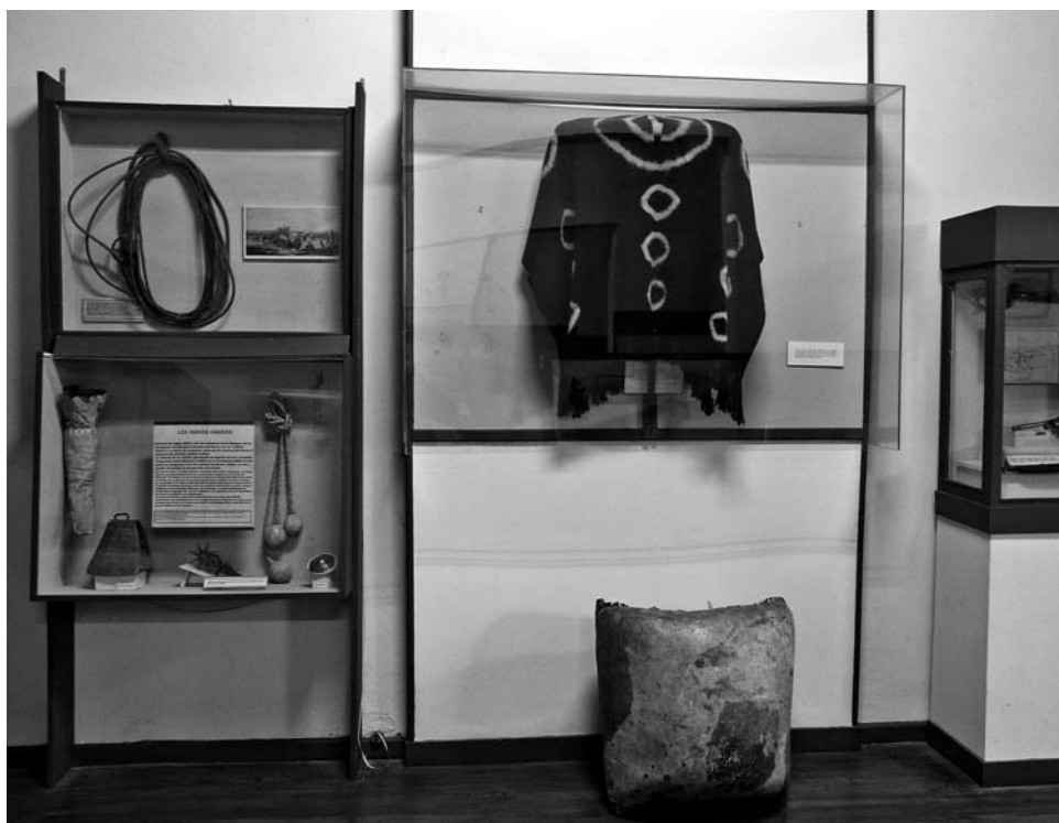
Foto 10. Museo Etnográfico «Dámaso Arce» de Olavarría. Objetos y prendas de la zona rural bonaerense durante el siglo XIX. Eran utilizadas tanto por indios como por criollos. Foto: Jesús Bustamante, agosto de 2011.

la cultura andina, en general objetos antiguos apoyados en fotografías folklóricas en color, hechas hace pocas décadas. Si esta parte de la exhibición se fundamenta sobre todo en la arqueología, la de las tierras bajas —zona chaqueña— es de un marcado carácter etnográfico y cruza distintos aspectos como las lenguas, las armas, y la producción tradicional de objetos de uso cotidiano. Una buena colección de máscaras y el apoyo explicativo de unos maniqués son parte importante de la exposición.