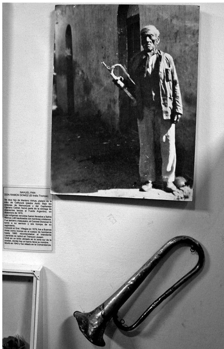
FOTO 8. Museo Municipal de Trenque Lauquen. Instrumento musical y fotografía del llamado «indio trompeta», personaje cotidiano en la ciudad en la década de 1940.