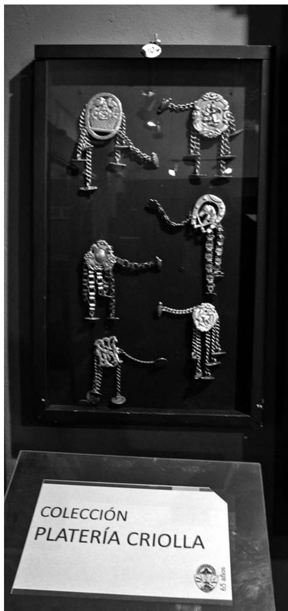
FOTO 14. Museo Etnográfico y Archivo Histórico «Enrique Squirru» de Azul. Parte de la colección de platería criolla. Rastras (piezas centrales para el cinturón). Foto: Jesús Bustamante, agosto de 2011.