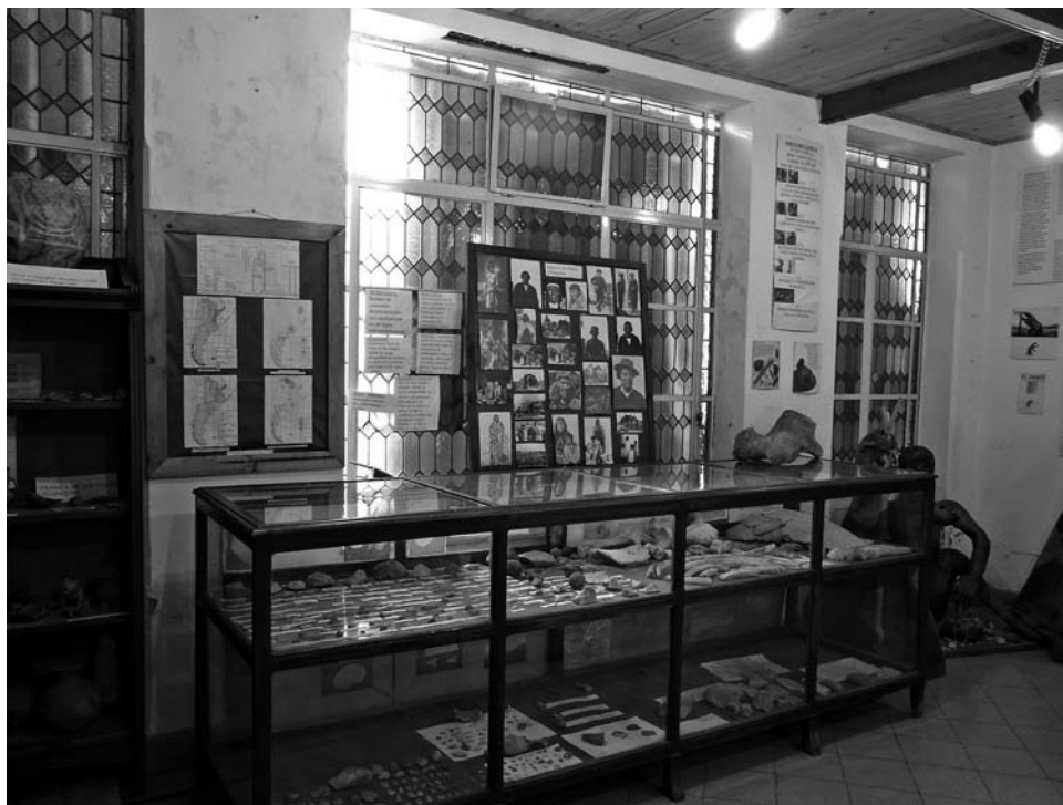
Foto 1. Museo «Julio de Vedia» de la ciudad de 9 de Julio. Restos líticos, fósiles y alfarería. Fotografías de dirigentes indígenas históricos del siglo XIX, mayoritariamente de la Patagonia. Foto: Jesús Bustamante, agosto de 2011.

gos— de las luchas del siglo XIX. Este cruzamiento es muy común en los museos de frontera.