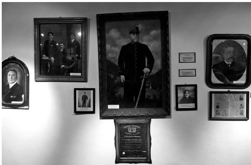
FOTO 17. Museo del Indio de Los Toldos. Fotografías que muestran a los hijos del cacique Ignacio Coliqueo con sus respectivas familias, después de la aplicación del ius soli . La figura central corresponde al Sargento Mayor Simón Coliqueo, considerado héroe de la batalla de Pavón y poblador respetado de la zona. Foto: Jesús Bustamante, agosto de 2011.