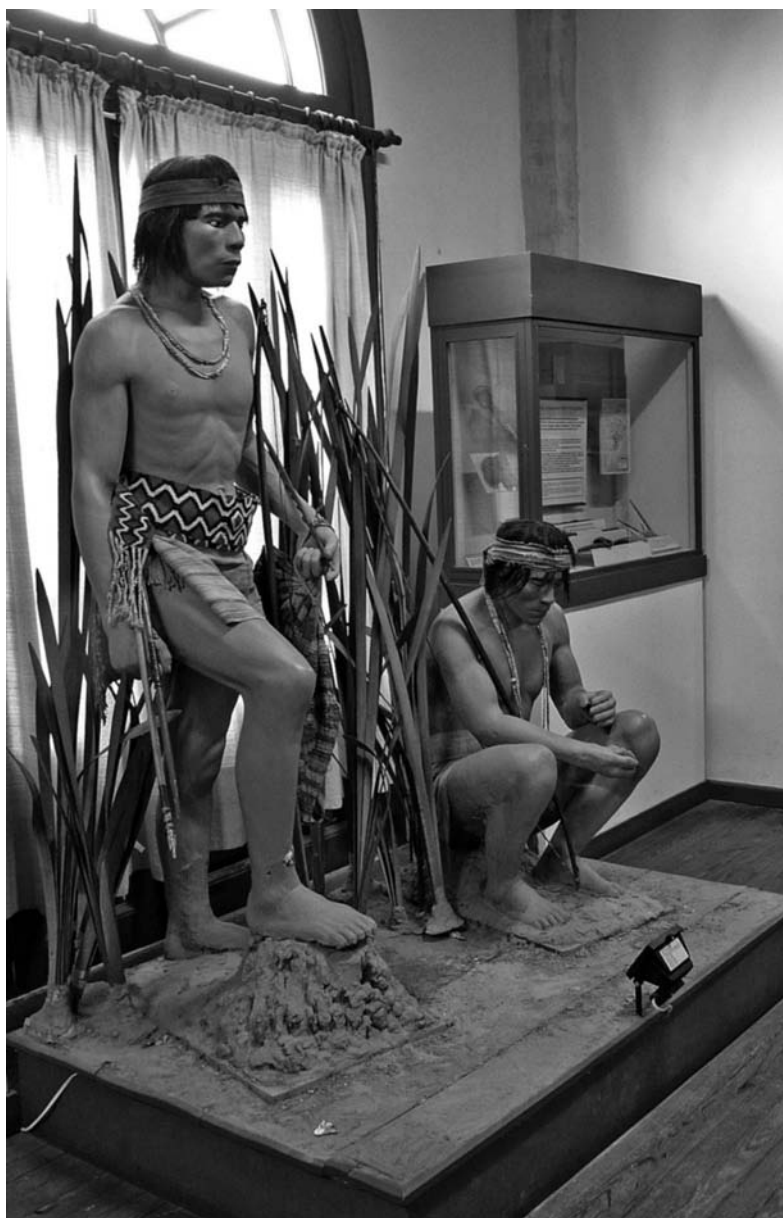
FOTO 11. Museo Etnográfico «Dámaso Arce» de Olavarría. Maniqués que muestran a los indios chaqueños del siglo XIX («hombres del bosque»), con sus armas y abalorios. Foto: Jesús Bustamante, agosto de 2011.