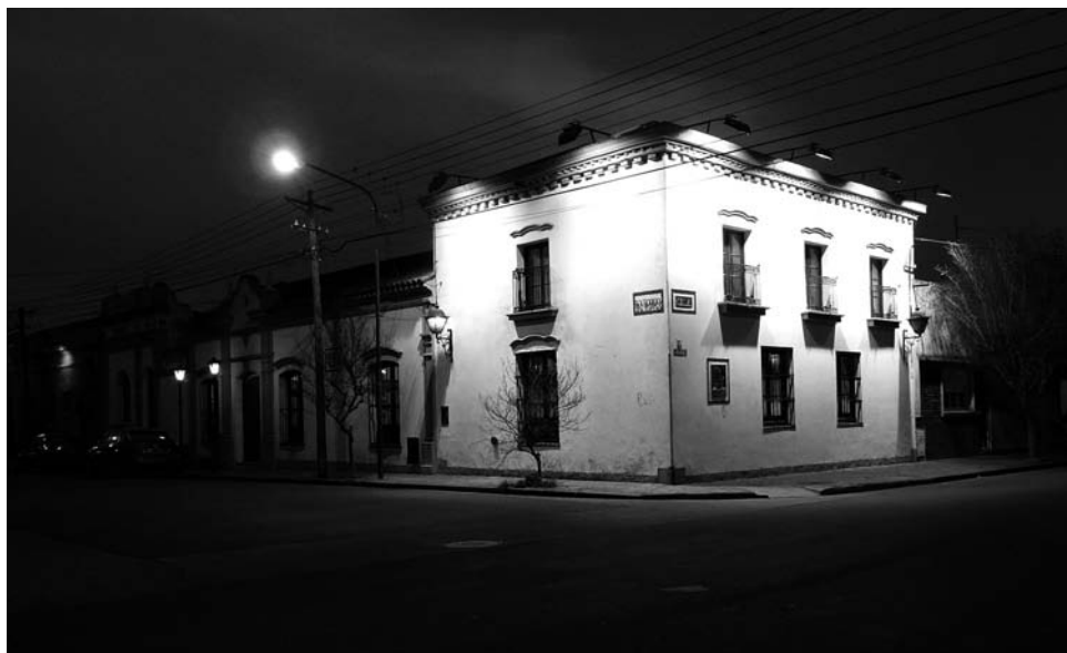
FOTO 12. Museo Etnográfico y Archivo Histórico «Enrique Squirru» de Azul. Fotografía de la casa que alberga al museo, la más antigua de dos plantas de la localidad (1854). Foto: Jesús Bustamante, agosto de 2011.

usados por las mujeres, que con la calidad y cantidad de estos señalaban su jerarquía dentro del grupo.