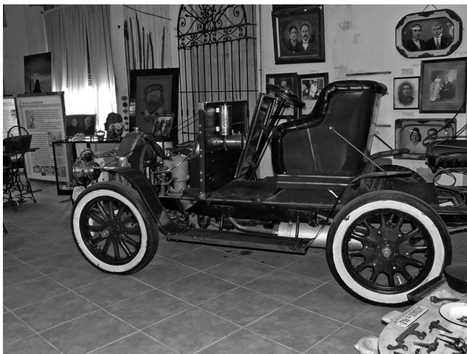
Foto 5. Museo Casa de Cultura de Tapalqué. Objetos, máquinas y fotografías cedidos por las familias del municipio. Foto: Jesús Bustamante, agosto de 2011.

dencia hasta los fusiles Rémington que tan importantes fueron para el cierre de la lucha con el indio, y que le da a este museo una cierta especificidad; así como la extensión que esta comunidad quiere dar a la exhibición de su trayectoria en el tiempo, que alcanza a objetos de tecnología mucho más reciente, como radios y televisores propios de la década de 1950.