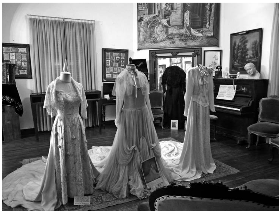
Foto 2. Museo «Julio de Vedia» de la ciudad de 9 de Julio. Objetos cedidos por las familias del municipio. Foto: Jesús Bustamante, agosto de 2011.

Finalmente, las motivaciones artísticas se expresan en un conjunto de cuadros pintados por artistas locales, del siglo XX hasta la actualidad. El origen del conjunto de las colecciones y obsequios, que atestiguan la voluntad de memoria colectiva de la comunidad, proviene de las familias criollas y de ascendencia inmigrante que han donado sus tesoros a lo largo de décadas. Las familias indígenas que pueblan los alrededores de 9 de Julio no están presentes en esta voluntad de memoria.