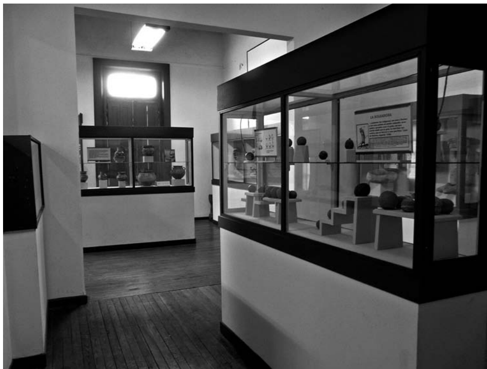
FOTO 9. Museo Etnográfico «Dámaso Arce» de Olavarría. Sala central con una vitrina dedicada al uso de las boleadoras. Desde allí se abren otras salas, como la que se ve al fondo destinada a los «hombres de la montaña» (noroeste). Foto: Jesús Bustamante, agosto de 2011.

ciones— sus cruzamientos con la población no indígena y la formación de una sociedad de frontera. Estas y otras perspectivas de la nueva historiografía son desarrolladas en un conjunto significativo de cartelas. El mismo discurso expositivo —es decir, señalando las contingencias históricas— vincula a esta parte de la exhibición con la correspondiente a los mitificados habitantes de la Patagonia y grupos fueguinos —alakalufes y onas—, estos últimos con fuerte apoyo de fotografías de viajeros ingleses y franceses del siglo XIX.