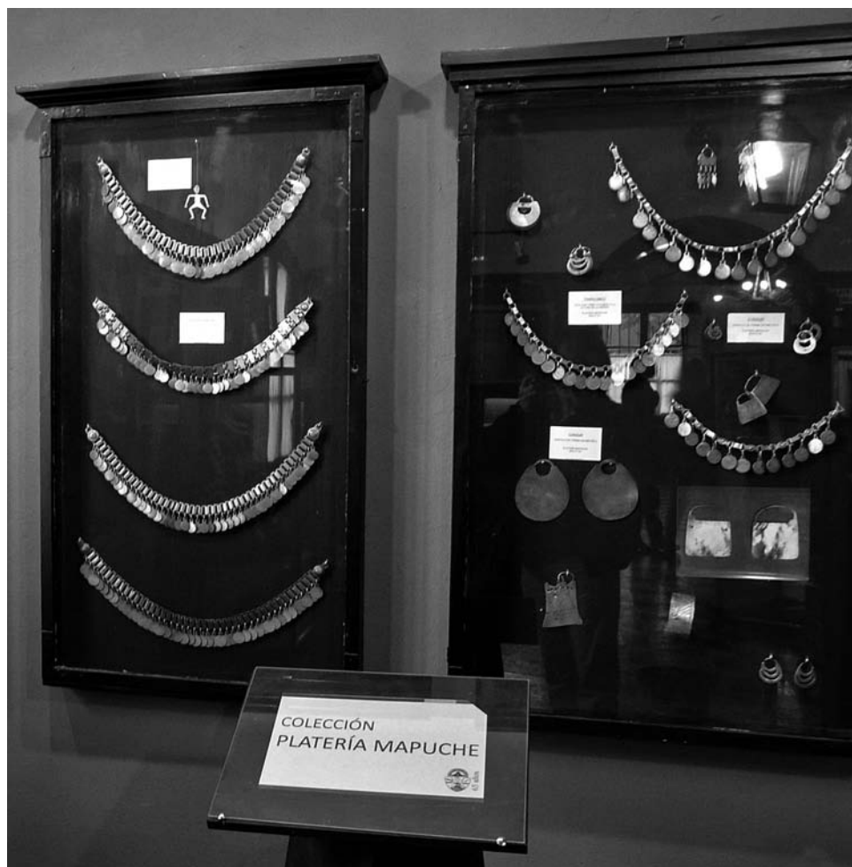
FOTO 13. Museo Etnográfico y Archivo Histórico «Enrique Squirru» de Azul. Parte de la colección de platería mapuche. Collares, pendientes y brazaletes. Foto: Jesús Bustamante, agosto de 2011.

De tal forma ambos lados de esta gran sala, derecha e izquierda, están destinados a mostrar respectivamente la cultura indígena y la criolla. Pero al frente de ella se abre un último espacio que, aprovechando la altura del antiguo edificio de dos plantas, muestra una colección de elementos utilizados en las tareas y actividades del campo. Lo más sorprendente es la presencia del mostrador y enrejado de una pulpería, trasladados completos al museo. El propósi-